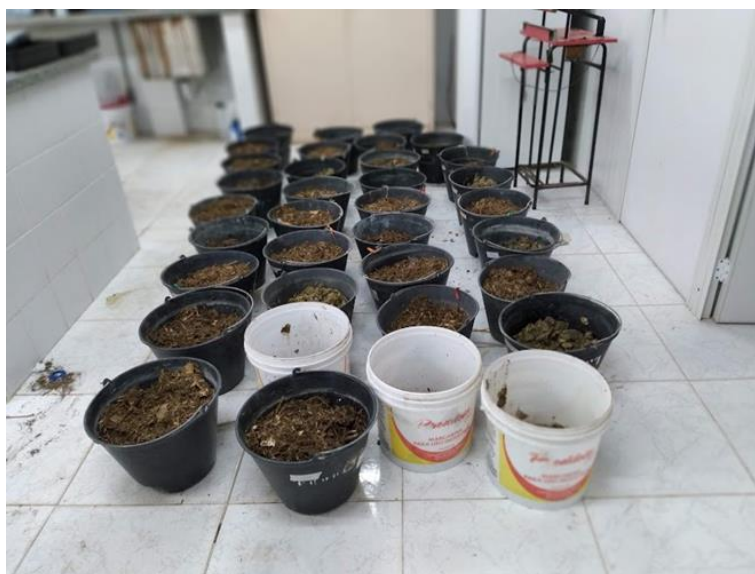
Figura 2. Silagens de palma contendo níveis inclusão de feno de leucena (0, 15, 30%) em exposição ao ar para avaliação da estabilidade.

A estabilidade aeróbia das silagens foi avaliada a partir do monitoramento da temperatura superficial e interna três vezes ao dia da silagem acondicionadas em baldes e exposta ao ar em sala com temperatura controlada. Foi considerado o início da deterioração, quando a temperatura interna das silagens atingiu 2°C acima da temperatura ambiente, medida utilizando termômetro digital (KUNG JR. et al. , 2000).