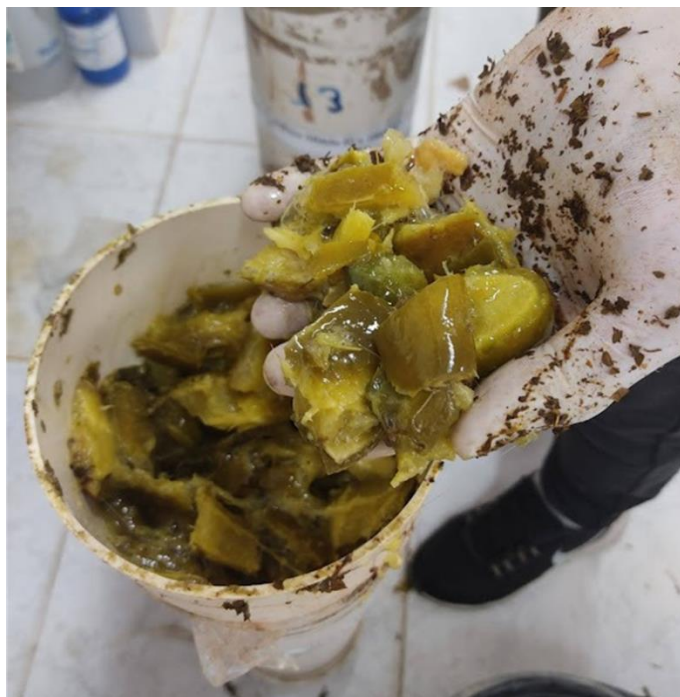
Figura 1. Silagem do cultivar de palma forrageira IPA Sertânia no momento da abertura do silo.

O pH das silagens foi determinado utilizando-se aproximadamente 9 g de amostra do material ensilado de cada tratamento e adicionado 60 mL de água destilada e após 30 minutos realizou-se a leitura utilizando um potenciômetro, de acordo com a metodologia descrita por Silva e Queiroz (2002).