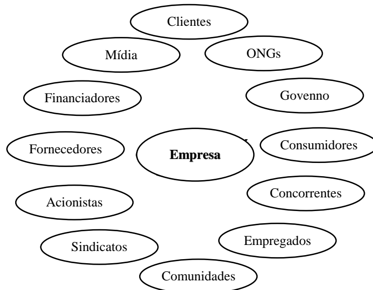
Figura 2 - Rede de stakeholders

Os stakeholders , para Harrison, Bosse e Phillips (2010), são entendidos como sendo todas as entidades que estão mais próximas e associadas com os objetivos e operações de uma organização. Já na visão de Oliveira (2008, p. 94), podem ser definidos como “[...] grupos de interesse com certa legitimidade que exercem influência junto às empresas” e que acabam por pressionar proprietários, gestores e acionistas, interferindo, de certa forma, no futuro da organização.