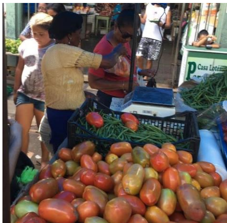
Figura 11: Barraca de hortifrúti

desde os oito anos de idade, é natural de Recife e mora atualmente no Engenho Maranguape. Não tem pais vivos. Comercializa hortaliças diferenciadas (pimentões vermelhos, berinjelas e alho poró). Atua na Praça Dom Vital, na lateral do Mercado de São José.