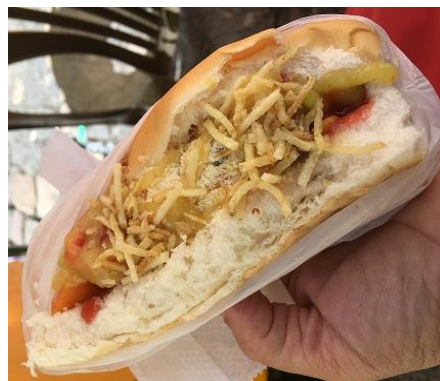
Figura 20. Sanduíche cachorro quente