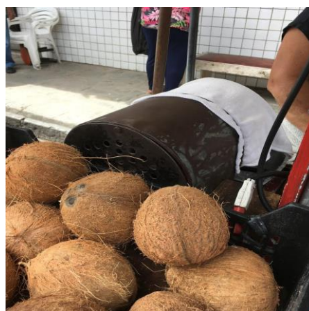
Figura 8: Moedor elétrico de coco