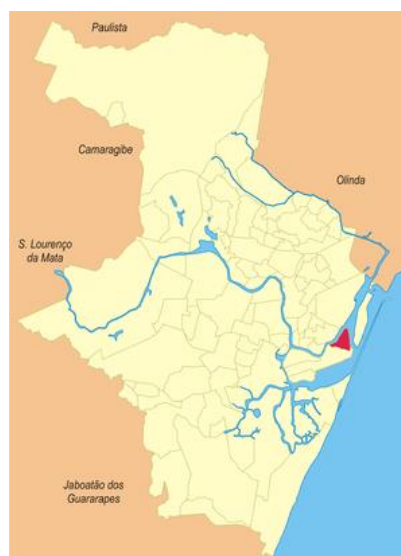
Figura 6: Bairro de Santo Antônio