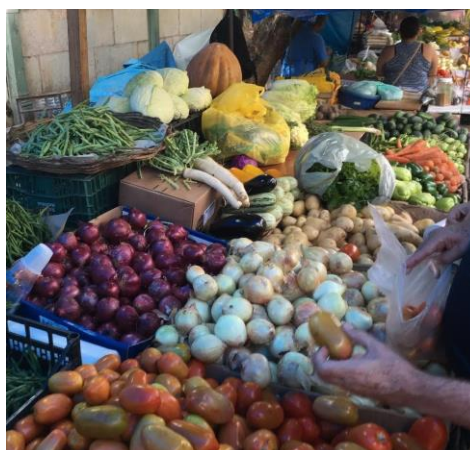
Figura 12: Barraca de hortifrúti