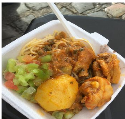
Figura 19. Prato feito de almoço (PF)

como os sanduíches de carne bovina moída, denominados aqui na região nordeste como cachorro quente, apresentado na Figura 20, e que traz uma livre tradução do sanduíche norte-americano cujo recheio é composto por salsichas, os hot dogs , e as coxinhas, que hoje se inserem ao lado das tapiocas e acarajés como um traço identitário do cotidiano alimentar do brasileiro.