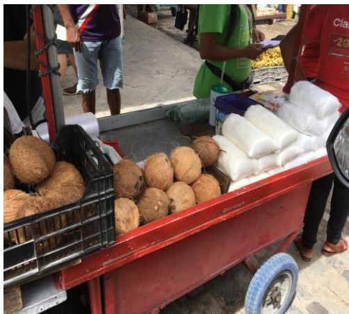
Figura 7: Barraca de goma e coco