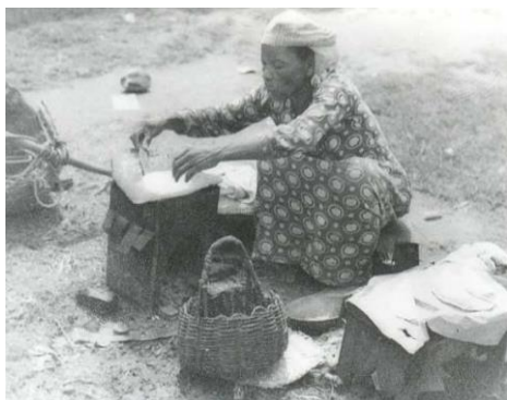
Figura 21. Vendedora de tapioca (1930-40)