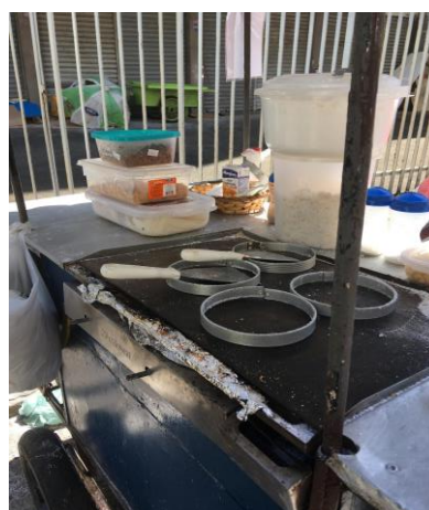
Figura 14: utensílios para feitura de tapiocas