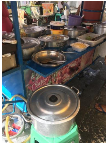
Figura 15. utensílios para o serviço dos “pratos feitos”