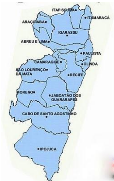
Figura 3: Mapa do Recife e Região Metropolitana

A cidade do Recife e Região Metropolitana, apresentadas no mapa da Figura 3 encontra-se dividida em microrregiões, divisão esta que visa mapear características sociopolíticas e comportamentais por região. Os bairros de São José, na Figura 5, e Santo Antônio, na Figura 6, estão inseridos na microrregião 1.2, que aparece delimitada na Figura 4, também compostas pelos bairros de Boa Vista, Cabanga, Ilha do leite, Paissandu e Soledade.