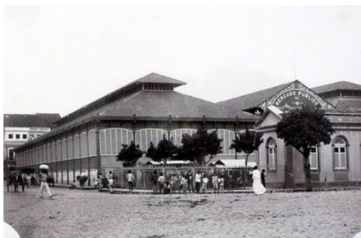
Figura 1: Mercado de São José em 1910