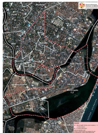
Figura 4: Mapa da Microrregião 1.2