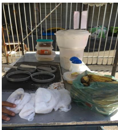
Figura 13: superfície de feitura da tapioca