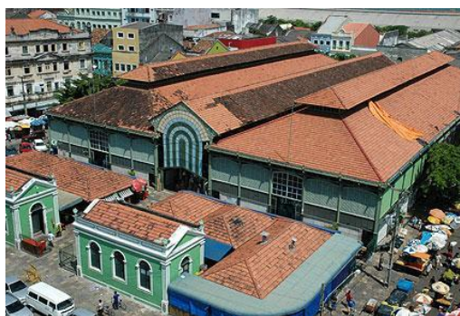
Figura 2: Mercado de São José em 2018