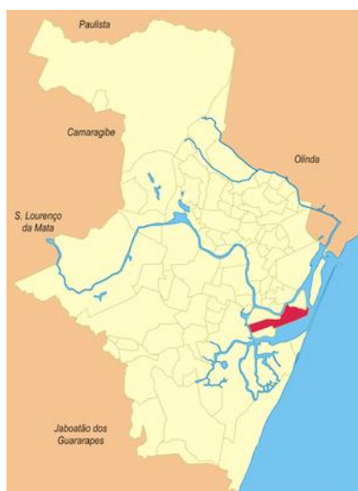
Figura 5: Bairro de São José