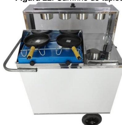
Figura 22. Carrinho de tapioca (2018)