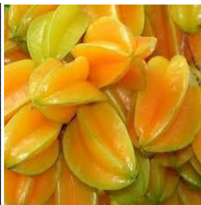
Figura 10: Carambolas