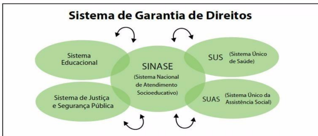
Figura 2. Sistema de Garantia de Direitos

Consistindo assim, no “conjunto ordenado de princípios, regras e critérios, de caráter jurídico, político, pedagógico, financeiro e administrativo, que envolve desde o processo de apuração do ato infracional até a execução de medida socioeducativa” (BRASIL, 2006, p. 22). O SINASE “constitui-se de uma política pública destinada à inclusão do adolescente em conflito com a lei que se correlaciona e demanda iniciativas dos diferentes campos das políticas públicas e sociais” (BRASIL, 2006, p. 23) como é possível observar na figura.