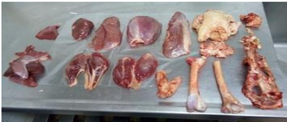
Figura 3. Componentes do pernil de ovinos após dissecação