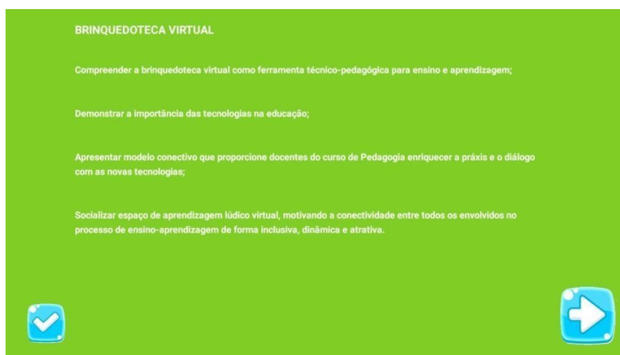
Figura 07: Concepção teórica do Projeto.

Na figura 07, a tela apresenta os objetivos do projeto, como também as teorias que embasam cientificamente a concepção virtual da brinquedoteca. Após acessar este espaço, o usuário terá, no canto direito da tela, setas que direcionam para informações do projeto, podendo alternar conforme o que se procura. Nesse acesso, o professor e o aluno podem expandir a pesquisa sobre o projeto, como também realizar pesquisas mais aprofundadas sobre os teóricos e suas teorias.