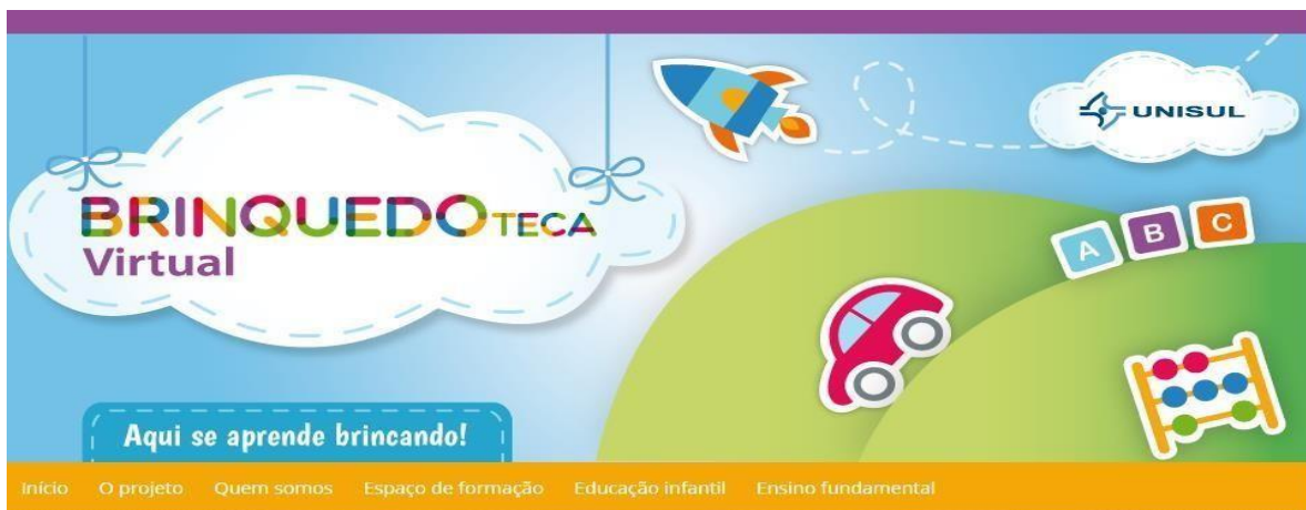
Figura 02: tela inicial da Brinquedoteca Unisul

A diversidade de espaços virtualizados com o intuito de educar é inúmera. O foco do qual se desenvolve tal espaço ajuda aos envolvidos projetar os espaços virtuais de forma que atraia o público alvo e atenda as demandas ao qual o projeto está proposto.