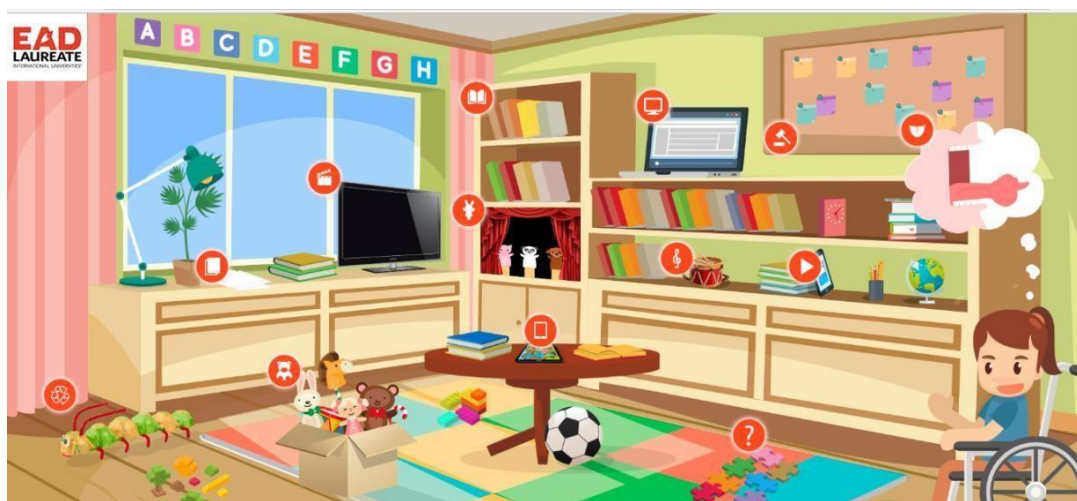
Figura 03: Tela Inicial da Brinquedoteca Laureate

A figura 03 demonstra como os campos de conhecimento podem ser acessados seguindo o padrão das demais, em que, orientado por ícones similares às áreas de conhecimento, o visitante ou comunidade acadêmica pode navegar de forma livre pela plataforma.