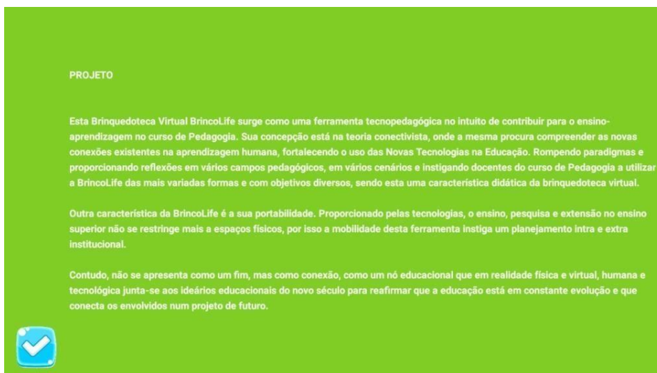
Figura 06: contextualização do projeto

Na figura 06, tem-se a apresentação do projeto. O objetivo desta informação na brinquedoteca virtual é fornecer embasamento para que, nos planos de aula e nas atividades propostas, o professor possa ter referências sobre o espaço virtualizado, e os alunos possam elaborar novas ideias e novas contribuições. possa