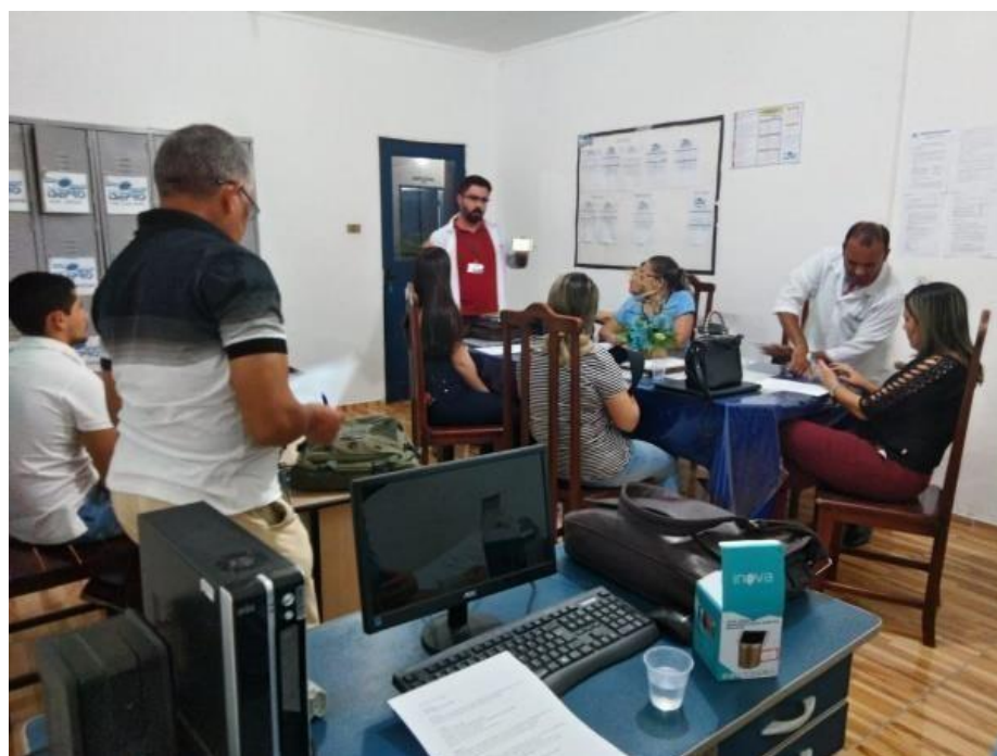
Figura 12: Apresentação do protótipo.

Como o intuito da ferramenta é ser um auxílio tecnológico no processo de ensino-aprendizagem, foram propostos roteiros de aprendizagem a serem seguidos em sala de aula como forma de validar a ferramenta e também receber contribuições para futuras atualizações.