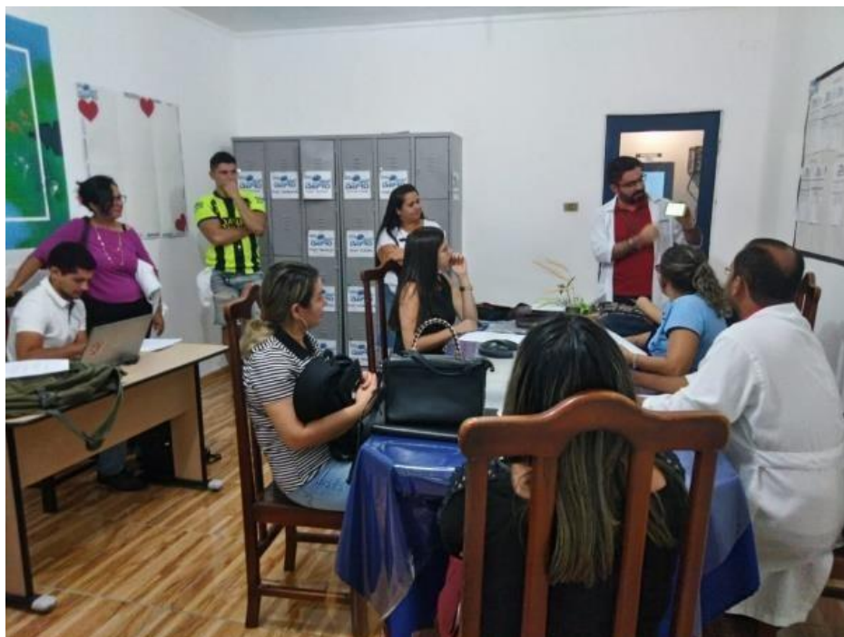
Figura 11: Apresentação do protótipo.