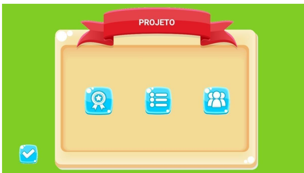
Figura 05: apresentação do projeto

A seguir, a figura 05 demonstra a contextualização do projeto, caracterização e motivação para produzir o aplicativo.