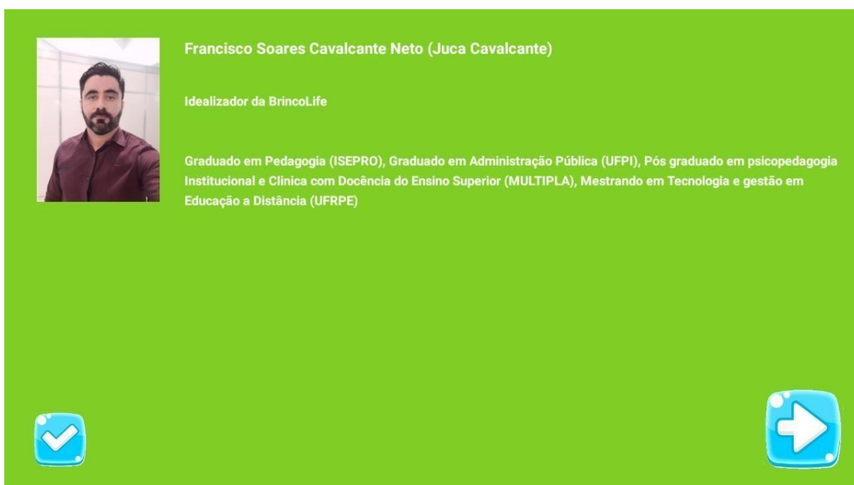
Figura 08: Idealizadores do Projeto.

Na figura 08, ao acessar esta tela, o usuário irá encontrar um minicurrículo dos idealizadores do projeto com suas respectivas imagens. O objetivo é que a equipe acadêmica possa inspirar-se e também desejar conhecer outros trabalhos dos envolvidos no protótipo. Ainda nesta tela, o usuário pode tocar na seta que fica do lado direito e será direcionado aos outros componentes do projeto.