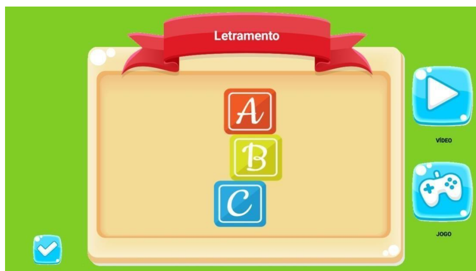
Figura 10: campos de conhecimento do projeto

Na figura 10, apresenta-se a tela de número 03 (letras), que vem identificada na fita superior; os ícones foram escolhidos por representar popularmente a sequência inicial do alfabeto. À direita da tela, aparecem dois ícones nomeados e que dão acesso a vídeo e jogo.