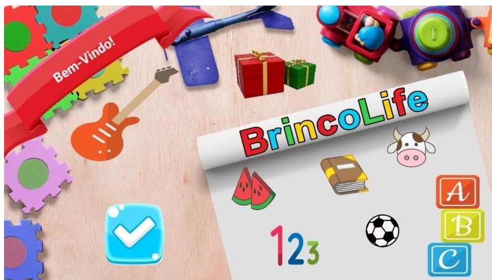
Figura 09: campos de conhecimento do Projeto.