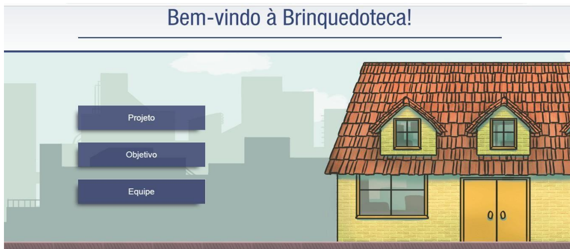
Figura 01. Tela inicial da Brinquedoteca Unisinos

Nessa figura, a tela inicial apresenta uma interface propositiva e que direciona o usuário para espaços informativos, como a idealização do projeto, objetivo e equipe.