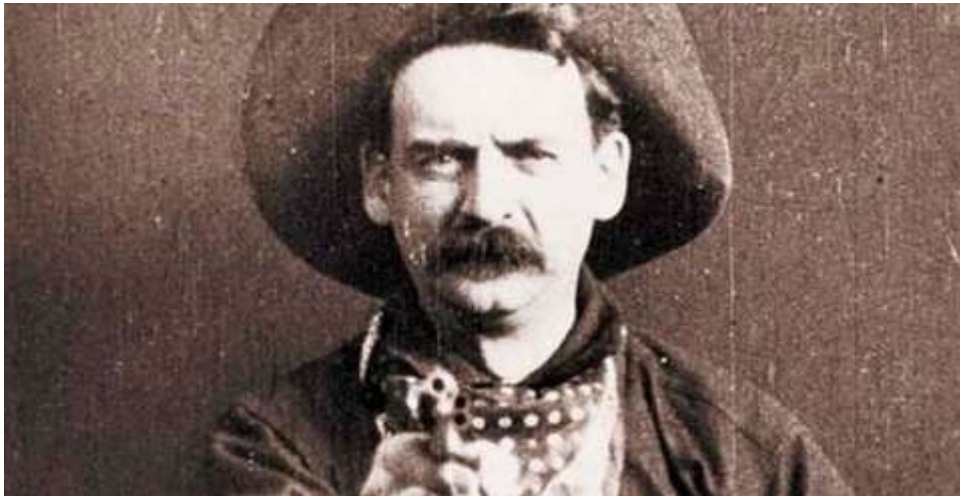
Imagem 5 – Frame do filme O grande assalto ao trem (1903).