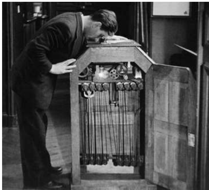
Imagem 2 – o Kinetoscópio

Esses tipos de diversões precisavam ser renovados constantemente, como no caso do kinetoscópio de Edison. Um estúdio chamado de Black Maria foi criado para aumentar a produção. Outros lugares começaram a exibir tais filmes como os pennyacardes , parques, hotéis. Segundo Calil (1996), alguns espaços que ficavam vagos, sobretudo nos finais de semana e a noite, viravam lugares de projeção. Isso aconteceu quase simultaneamente em Berlim, Paris, Bruxelas, Londres e Nova York (HOBSBAWM, 2015).