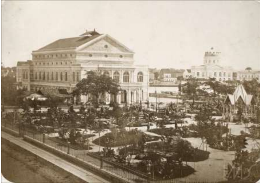
Imagem 7 – Vista do Teatro Santa Isabel no século XIX.