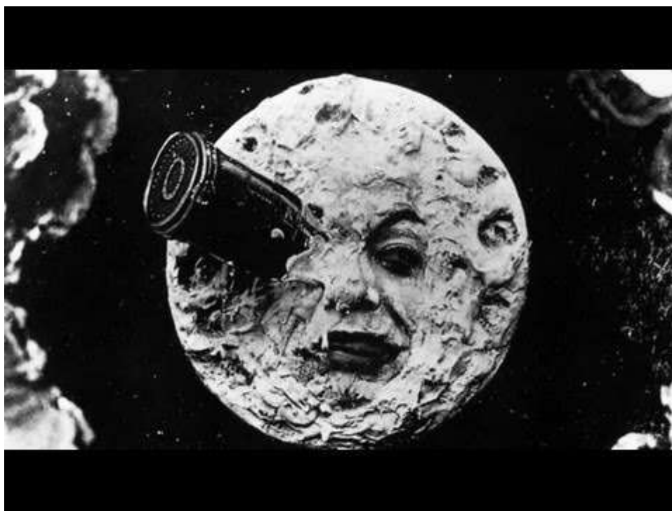
Imagem 15 – cena do filme Viagem à Lua.

Após uma breve e positiva passagem pelo Recife, a companhia iria para a Bahia, seguindo viagem para outras cidades como o Rio de Janeiro, São Paulo e Porto Alegre, sempre com uma programação sempre variada, mas similar ao que foi visto no Recife. O público recifense pôde observar a bala bater na lua e ela se metamorfosear em um rosto humano, a ilusão visual dos filmes de Méliès devem ter impressionado o público dessa província oceânica.