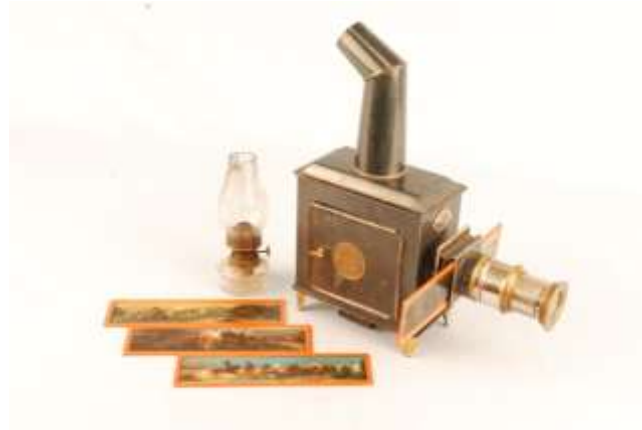
Imagem 1 – Lanterna Mágica.