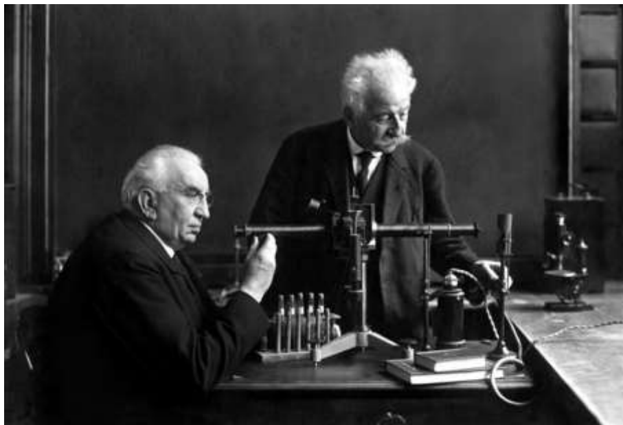
Imagem 4 – Os Irmãos Lumière.