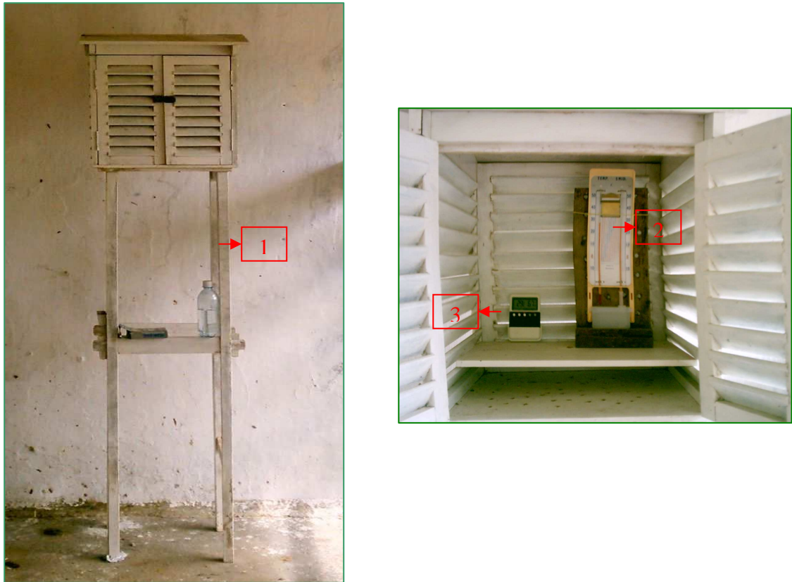
Figura 1 - Abrigo termométrico localizado no interior do galpão experimental (1), o psicrômetro (2) e o termoigrômetro digital (3).

834 835 836 837 838 839 840 841 842 843 844 845 846 847 848 849 850 851 852 853 854 855 856 857 858 859 860 861 862 863 864 865 866 867