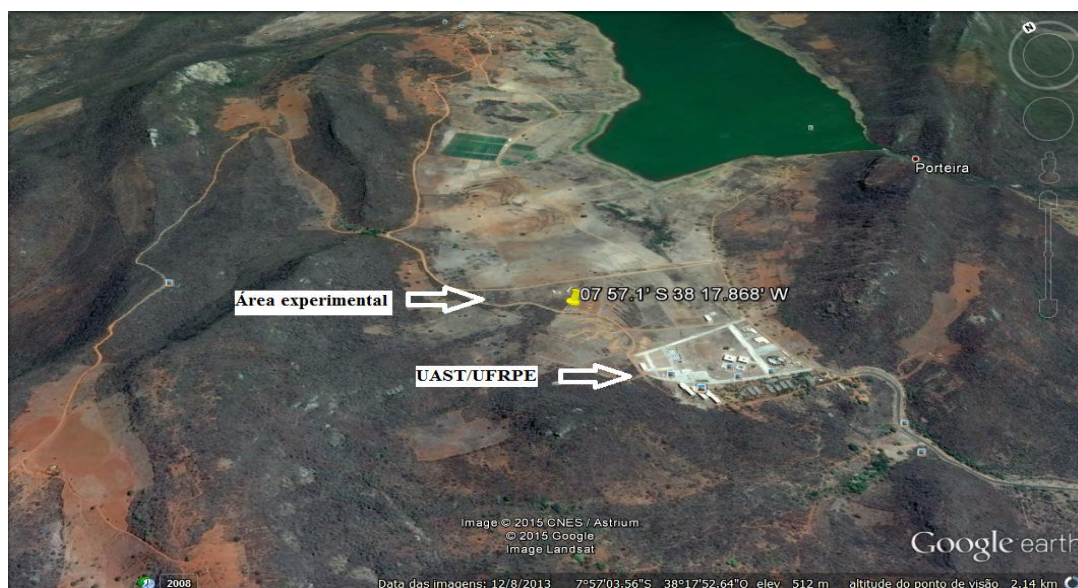
Figura 1. Localização da área experimental.

Ocorreu precipitação pluvial média por semana experimental de 6,67 mm no primeiro ano e 18,75 mm no segundo ano de estudo, apresentando temperatura média de 23,97 °C e 25,6 °C, para o primeiro e segundo ano, respectivamente. Os dados para o cálculo destas variáveis, foram obtidos através de uma estação meteorológica automática do Instituto Nacional de Meteorologia (INMET), localizada no campus da UAST/UFRPE.