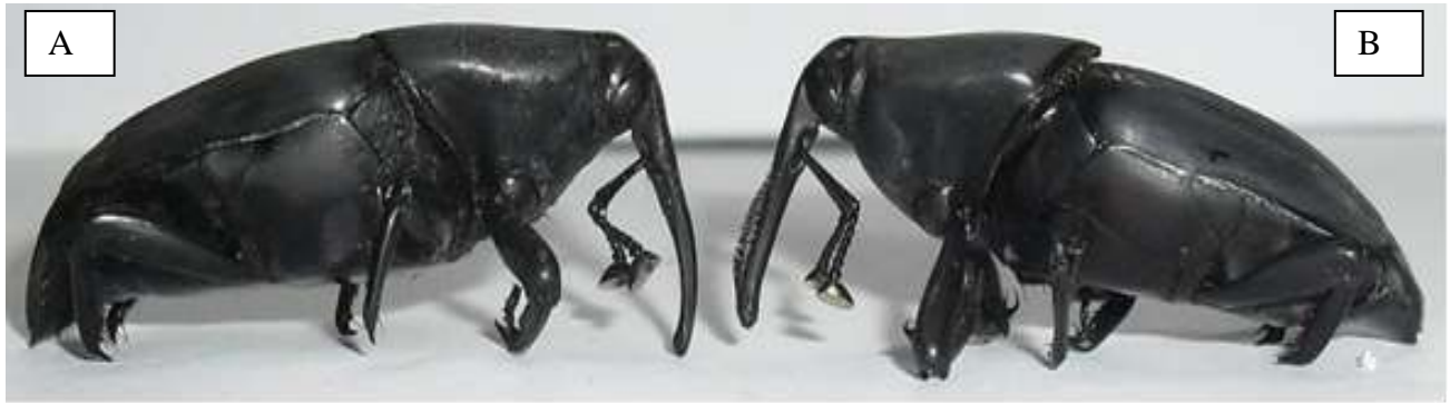
Foto 1. Dimorfismo sexual de Rhynchophorus palmarum , realizado pela presença de cerdas no rosto dos machos: fêmea (A) e macho (B) (Foto: Correia, R. G. 2011).