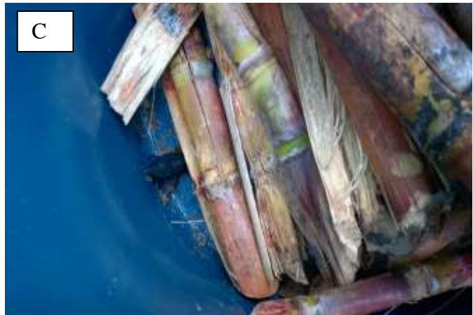
Foto 2. Armadilha artesanal para a captura de R. palmarum utilizada no estudo. Armadilha em campo (A), Armadilha aberta com sachê de feromônio sintético (B) e interior da armadilha com inseto capturado (C).