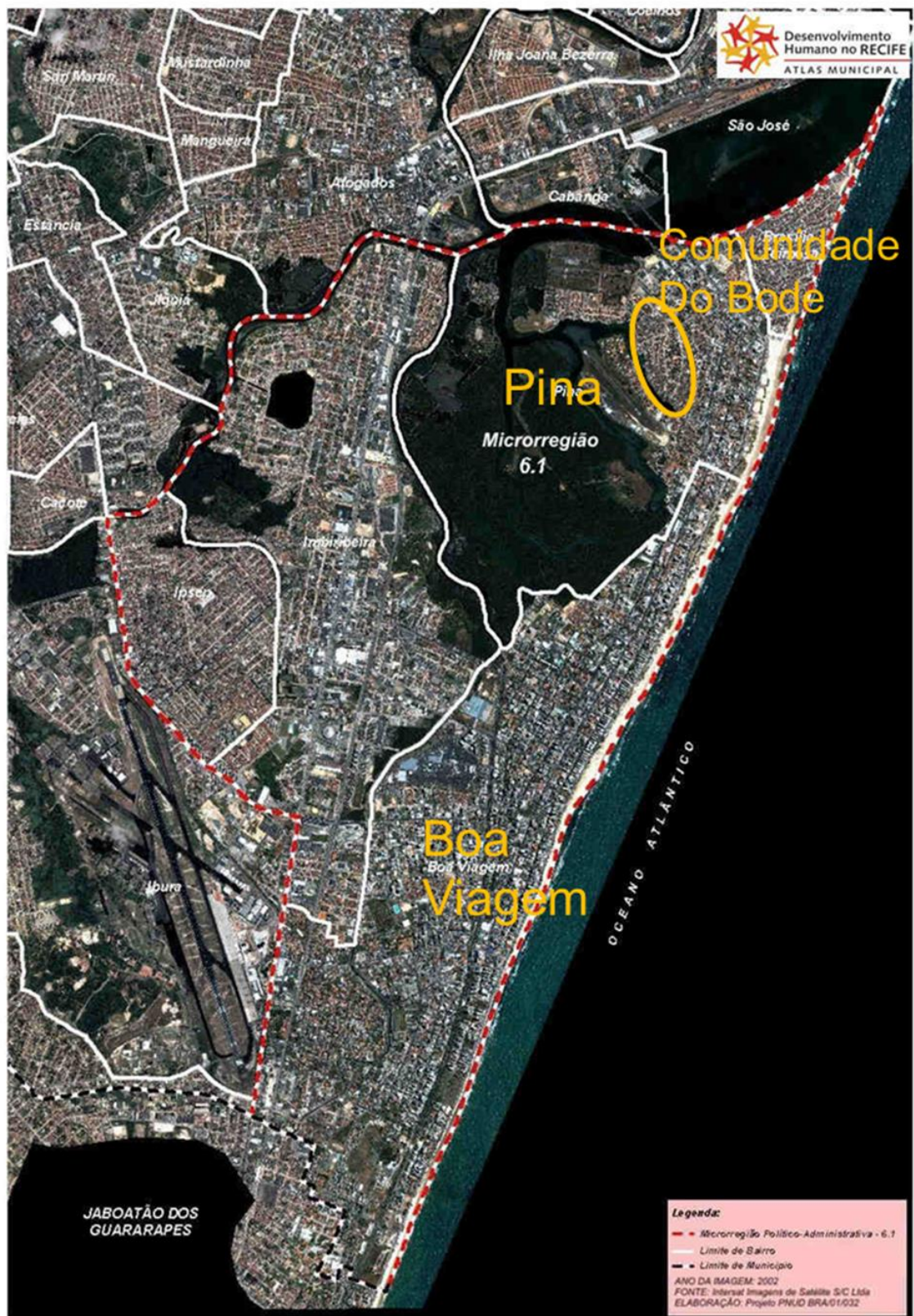
Mapa 01: Microrregião 6.1

http://www.recife.pe.gov.br/pr/secplanejamento/pnud2006/doc/mapas/satelite/micro6_1.jpg