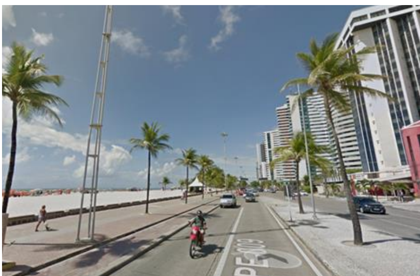
FIGURA 03 – A Avenida Boa Viagem no Pina.