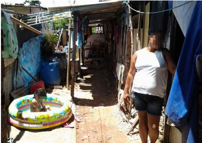
Figura 01 – Piscina infantil em um barraco sem serviço de água

Janeiro de 2013.