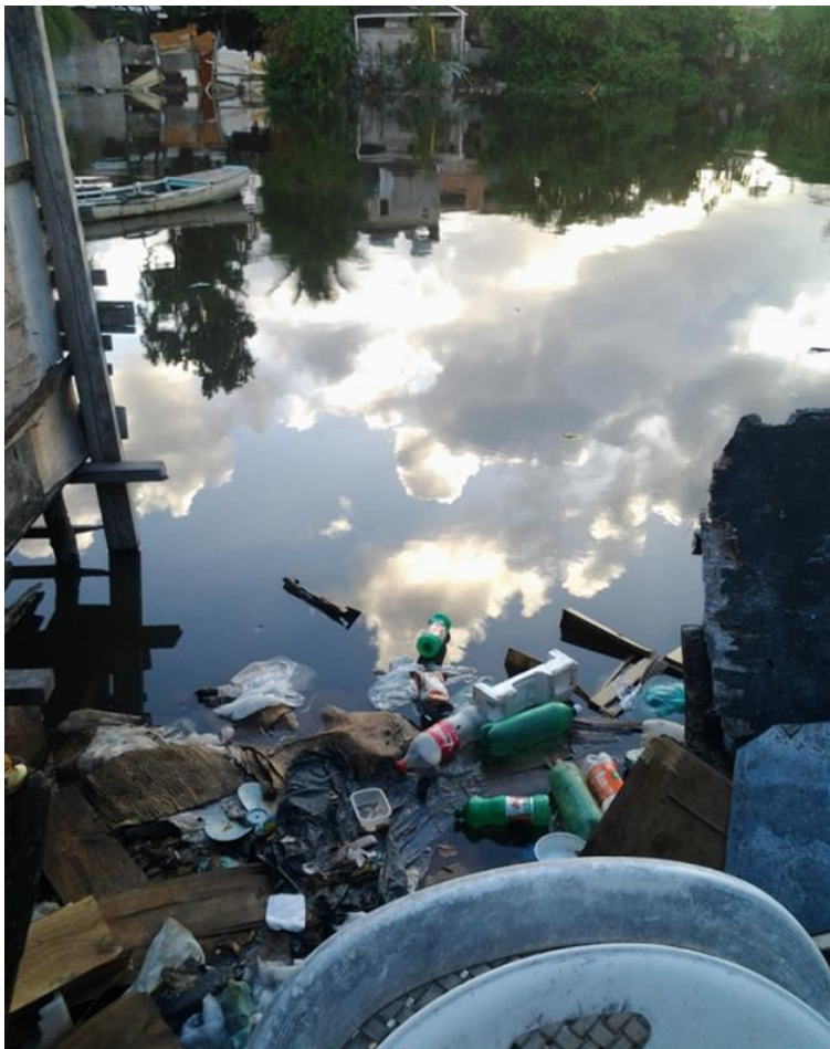
FIGURA 02 – A “maré” da Comunidade do Bode