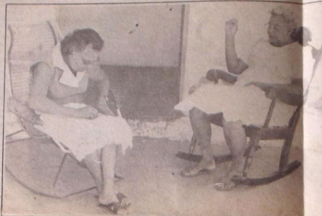
O bate-papo na calçada complementa o trabalho de dona Dada e dona Porcina