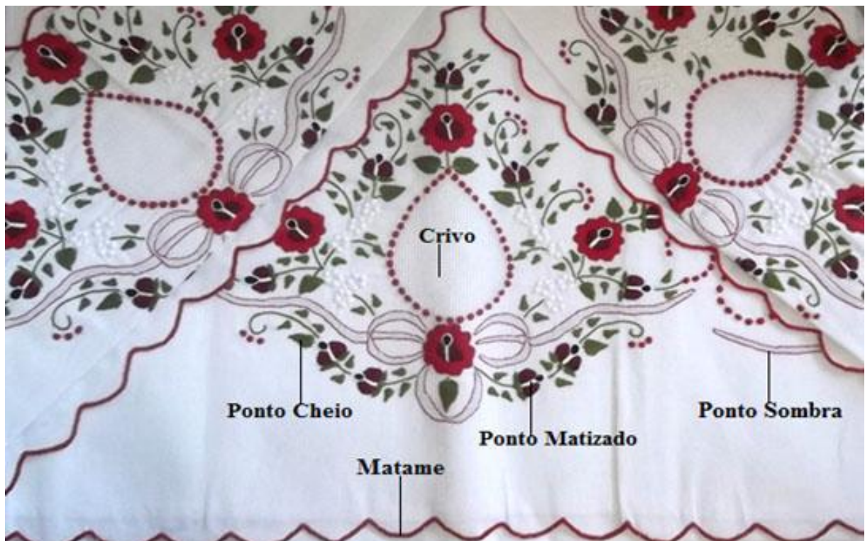
Fotografia 3 – Os pontos mais recorrentes no bordado produzido em Passira.

Diante dessa descrição e do reforço do depoimento de D. Nena, apresentamos na fotografia abaixo o tradicional bordado de Passira, caracterizado pela reprodução desses pontos e desses desenhos: