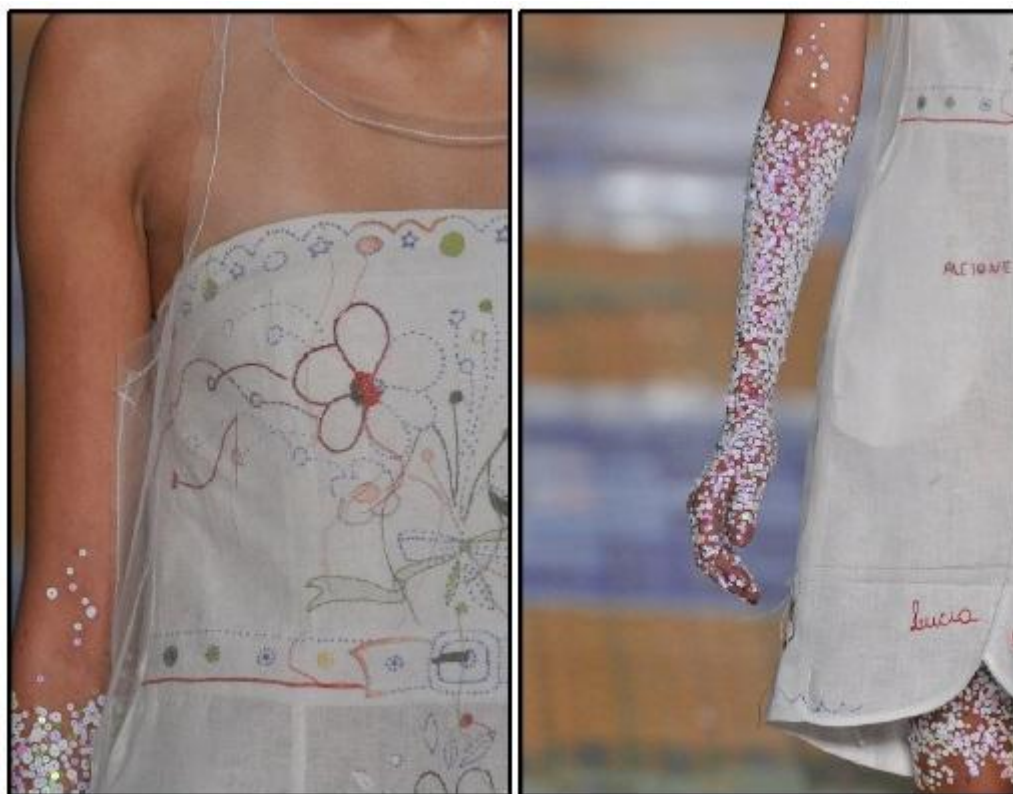
Fotografia 16 – Detalhes bordados de uma das peças da Coleção “Turista Aprendiz”.

As peças bordadas e desfiladas integraram a coleção de Ronaldo Fraga chamada “Turista Aprendiz” 175 . (Ver Fotografia 16). Esse trabalho foi desenvolvido a partir das visitas feitas pelo estilista à cidade de Passira. Nessas ocasiões foram realizadas oficinas de criação, de modo que as bordadeiras da AMAP apresentassem o que já bordavam comumente e que fossem estimuladas a criar desenhos inéditos, diferente de tudo aquilo que já haviam riscado em seus bordados.