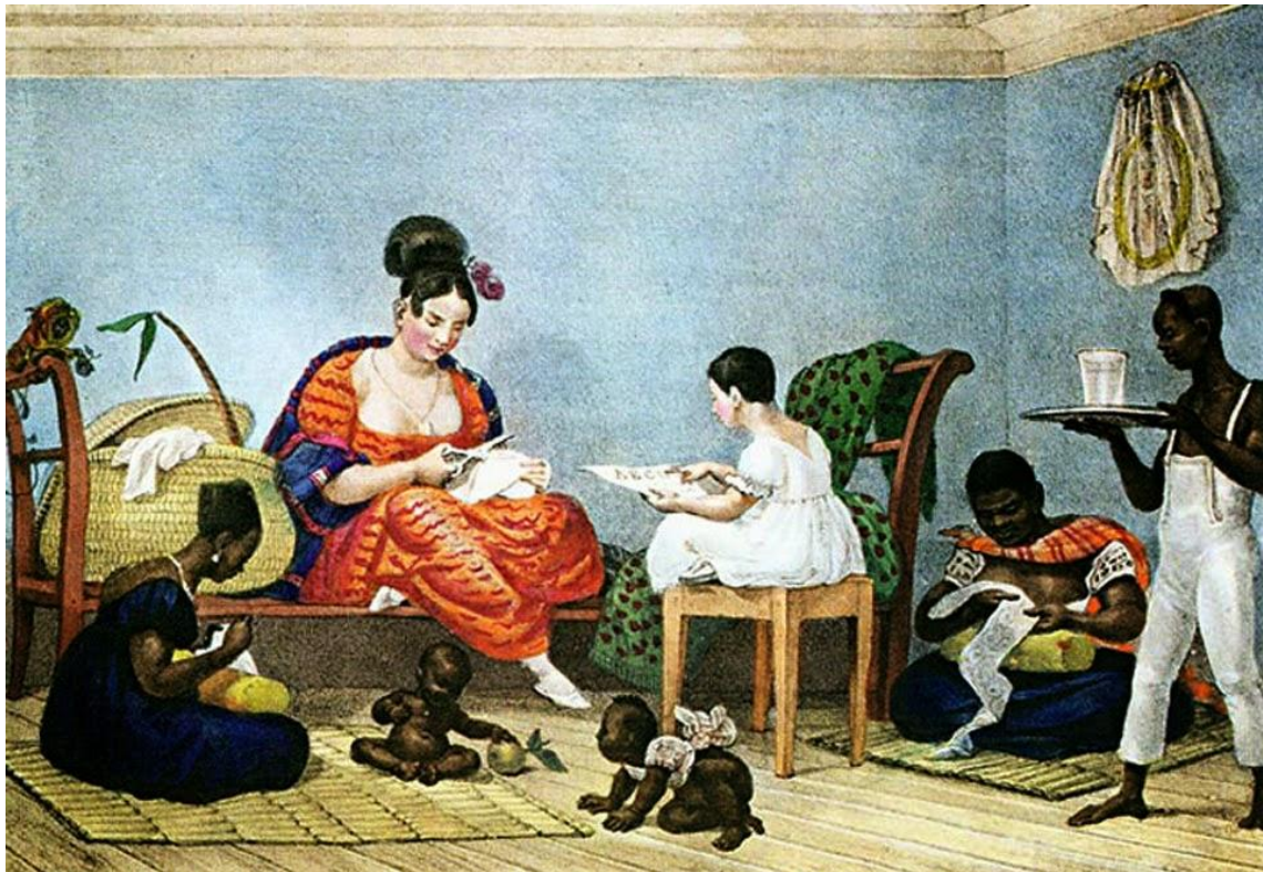
Imagem 7 – Uma senhora brasileira em seu lar. Jean Baptiste Debret. Coleção Voyage Pittoresque et Historique au Brésil (1834 – 1839)