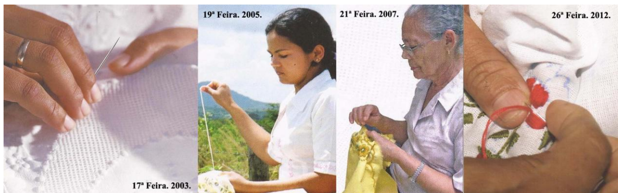
Imagem 4 - Fotografias usadas para divulgação das Feiras do Bordado Manual. Borda-se sem o bastidor.