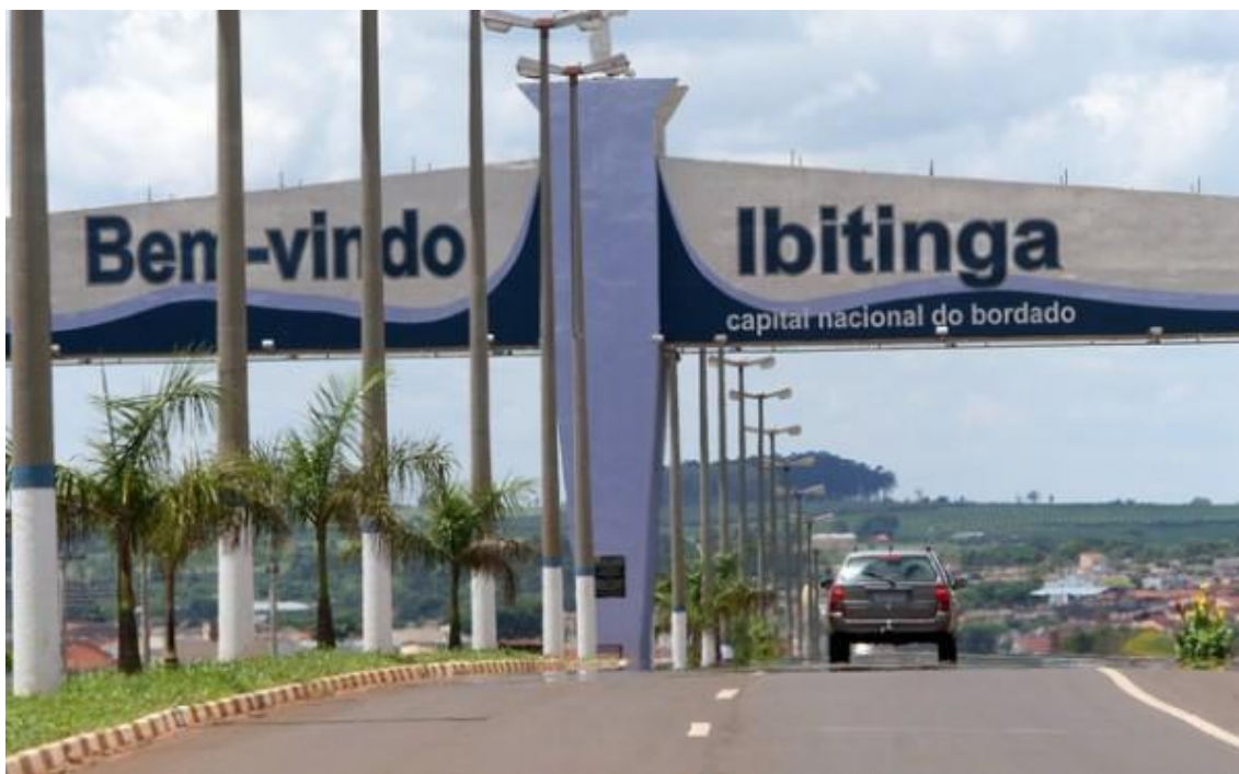
Fotografia 19 – Outras terras do bordado.