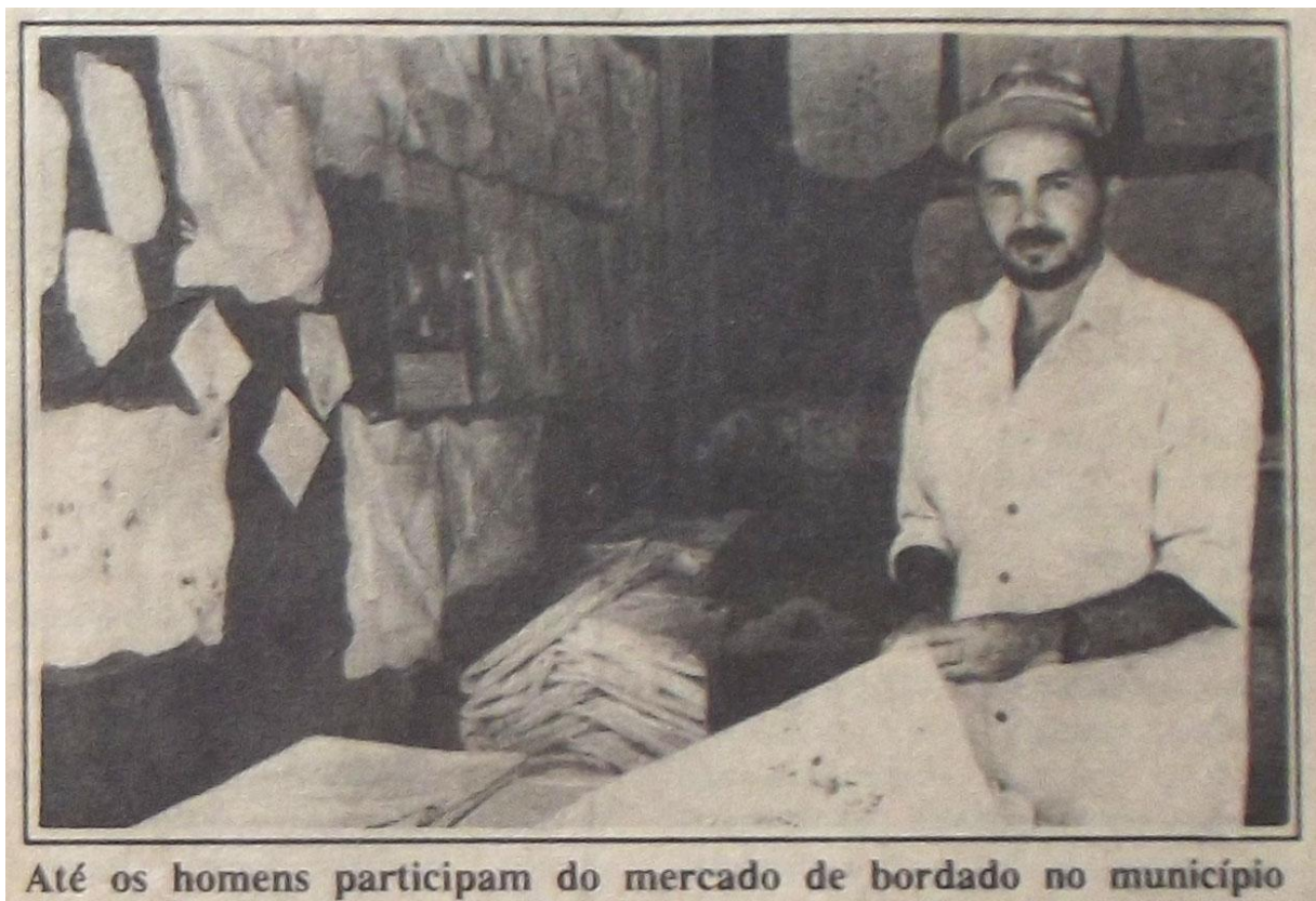
Fotografia 10 – Outras personagens do bordado: os bordadores.