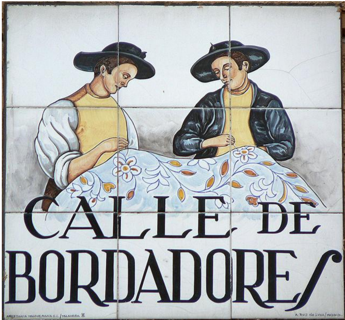
Imagem 5 - Placa da Rua dos Bordadores no Centro de Madri, na Espanha.