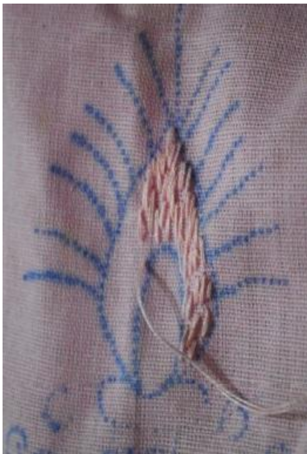
Fotografia 18 – Ponto Doidinho.

O bom exemplo dessa “incorporação de novos temas” foi a invenção do ponto “doidinho”, registrada em Almeida (2013, p. 139). (Ver Fotografia 18) O novo ponto foi inventado ainda na época do trabalho com Ronaldo Fraga, e foi, segundo relato de uma das bordadeiras à autora, uma forma de preencher grandes espaços utilizando pouca linha. Inclusive, pela irregularidade planejada do ponto, não se havia a necessidade do preenchimento total do desenho.