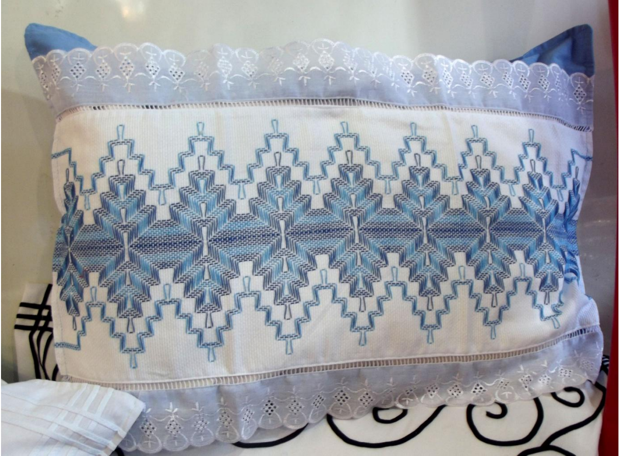
Fotografia 5 – Bordado Vagonite. Estande “Gigi Artesanato” na 28ª Feira do Bordado Manual.