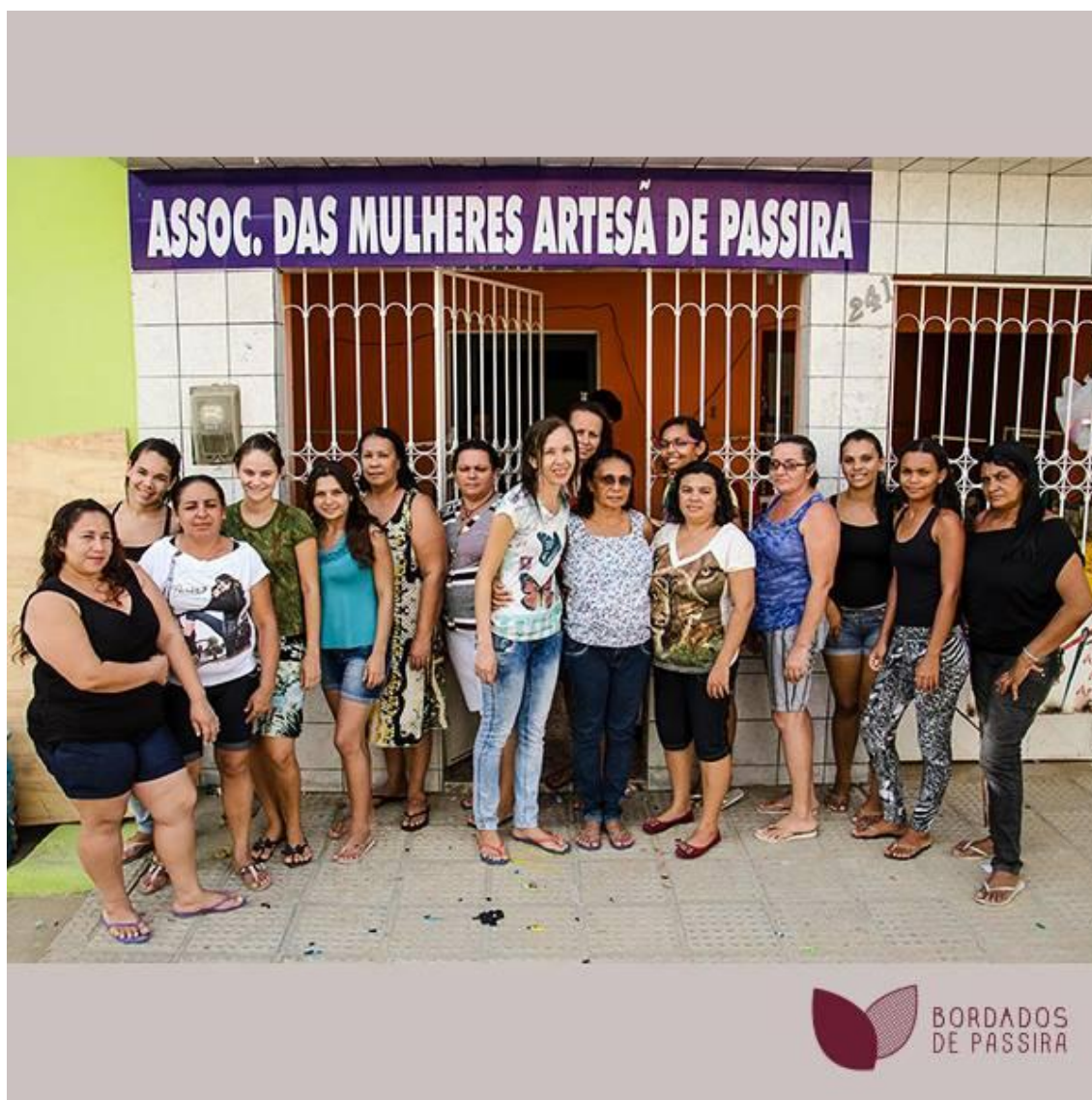
Fotografia 17 – Bordadeiras da AMAP em foto para o Projeto Bordados de Passira.

176