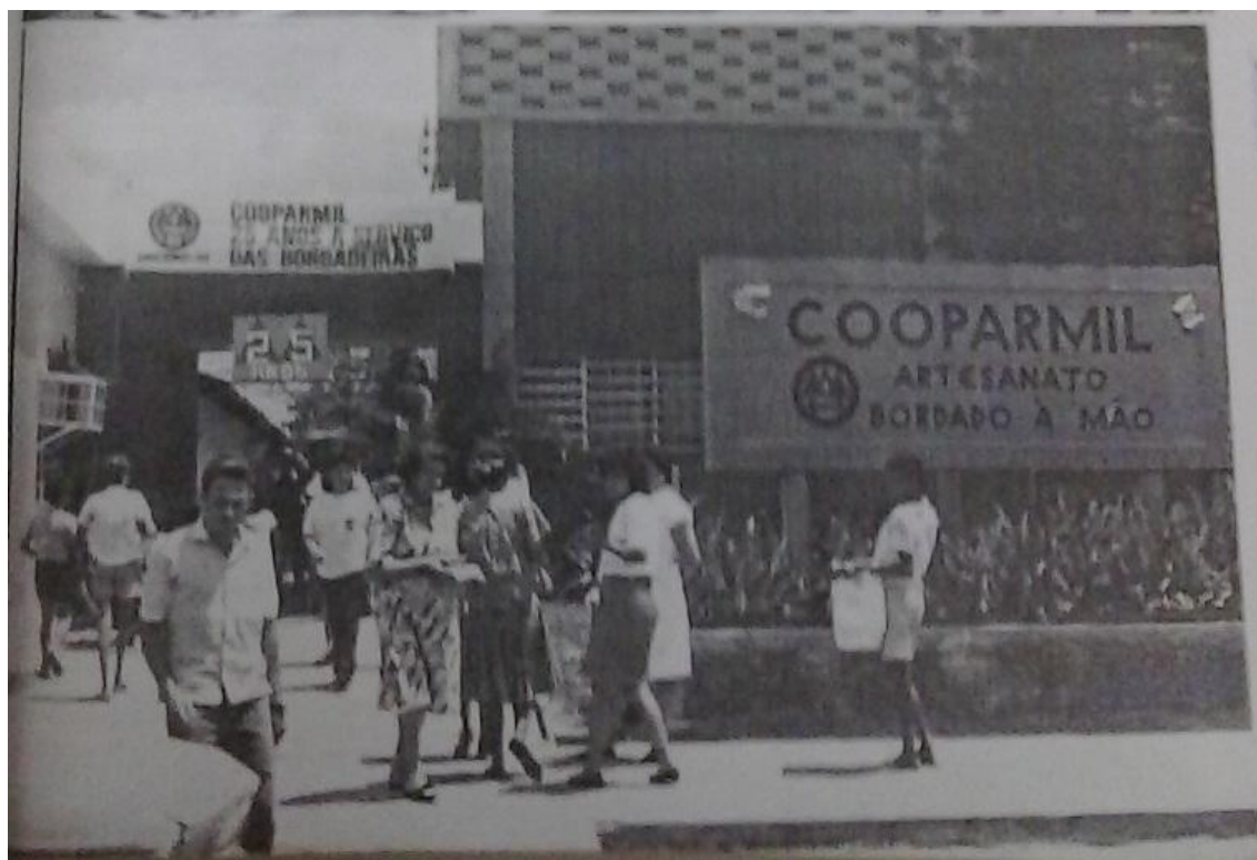
Fotografia 15 - COOPARMIL: Artesanato bordado à mão.