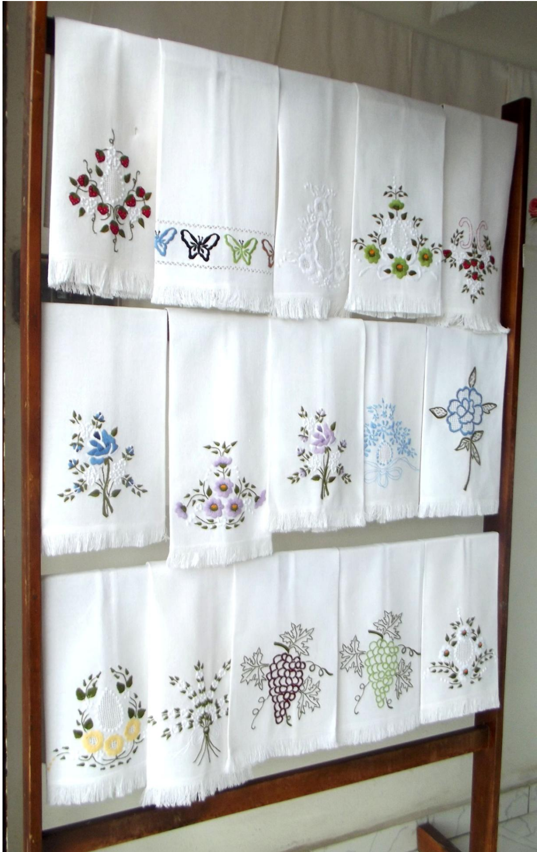
Fotografia 4 – Mostruário de panos de prato. Loja de D. Ester.