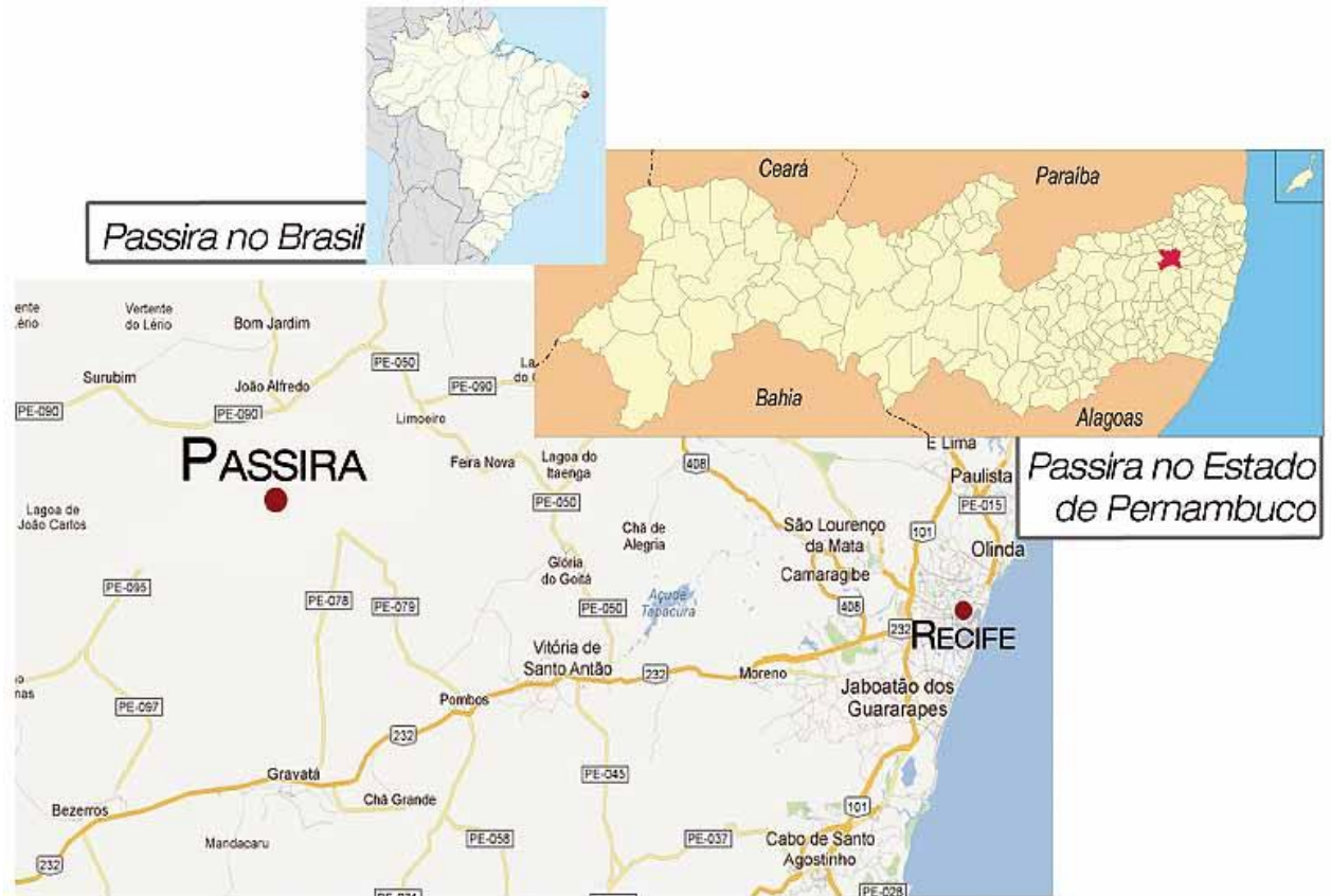
Imagem 1 – Localização da cidade de Passira.