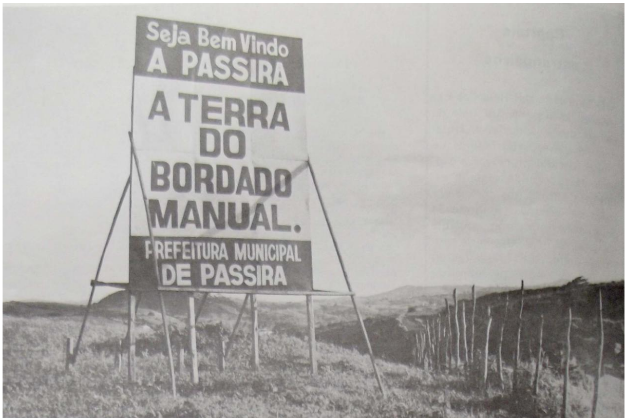
Fotografia 2 - Placa sinalizando boas vindas à “Terra do Bordado Manual”.