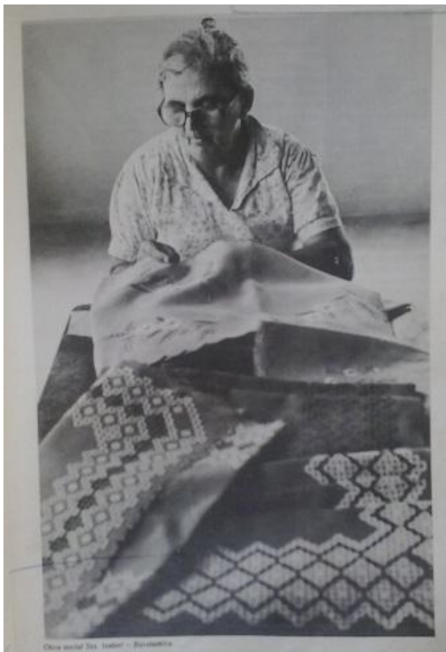
Fotografia 14 - Bordadeira na OSSI.