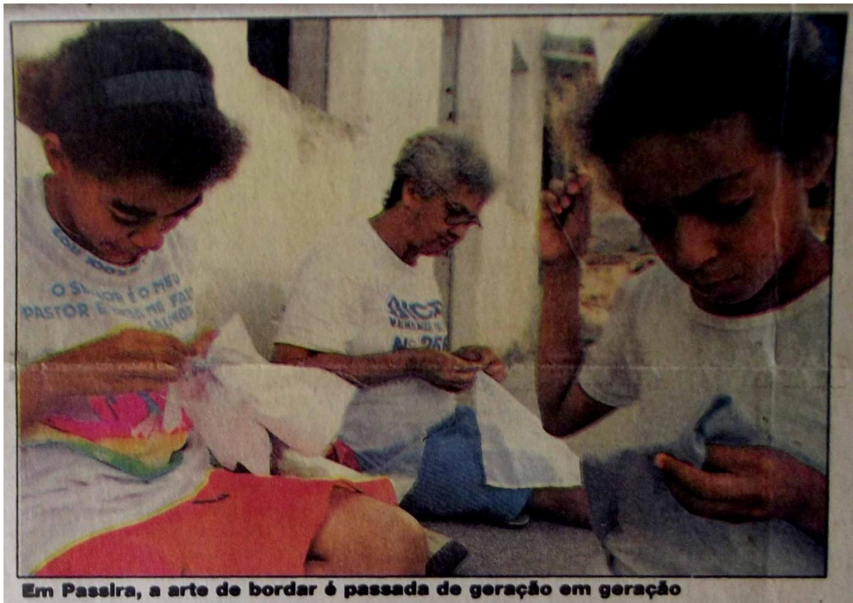
Fotografia 7 – Borda-se nas calçadas.

Além disso, as falas das nossas entrevistadas coincidem com as imagens as quais tivemos acesso durante a pesquisa. Sempre em âmbito doméstico, até quando associadas de associações/cooperativas, a maioria das bordadeiras bordam em suas casas, dividindo seu tempo entre os afazeres domésticos e a execução do bordado; existem aquelas que, trabalhando para si mesmas, donas de seus estabelecimentos comerciais, dividem seu tempo entre as vendas e o bordado; e existem aquelas que, bordando para terceiros ou para si mesmas, conciliando com outras atividades ou não, bordam nos terraços, nas calçadas, a céu aberto, onde a luz do dia ilumina melhor que qualquer outra e se consegue bordar sem forçar tanto a vista.