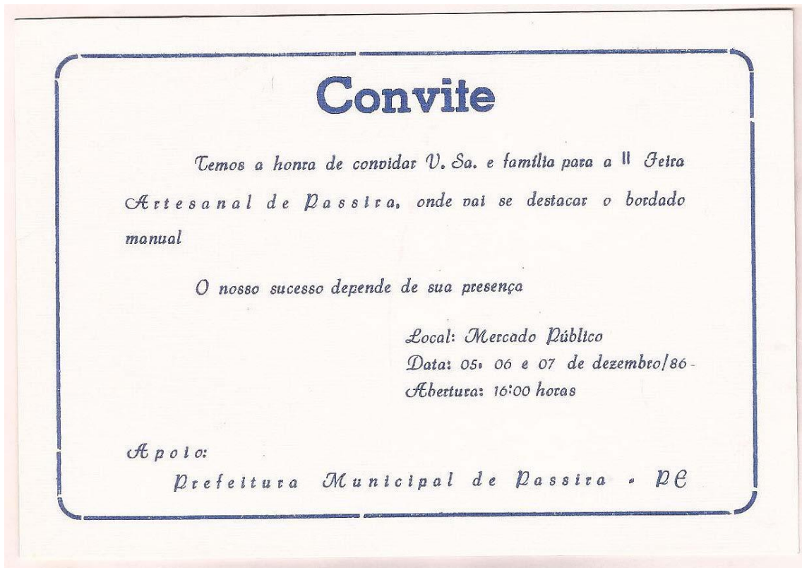
Imagem 8 – Convite da II Feira Artesanal de Passira. Dezembro de 1986.