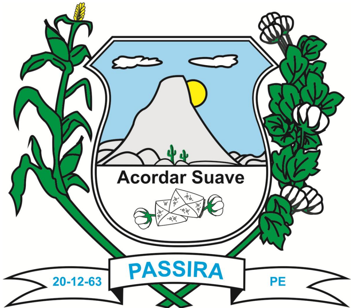
Imagem 2 – Brasão do Município de Passira.