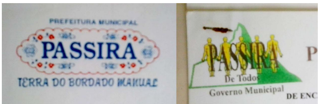
Imagem 3 – Da esquerda para a direita: Slogan adotado na gestão de 1993; slogan usado na gestão de 2001.