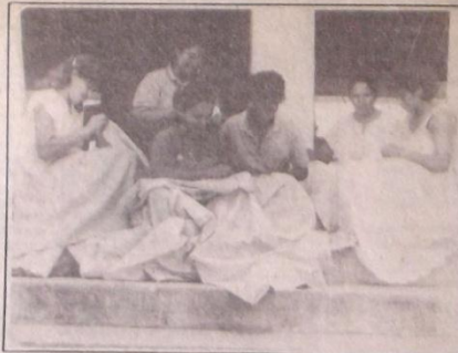
Algumas bordadeiras da Comib

mente, cerca de Cr$ 1.000,00 e participam de feiras e exposições artesanais dentro e fora do Estado. O atual prefeito, Antônio Laurentino, dá continuidade a obra do antecessor.