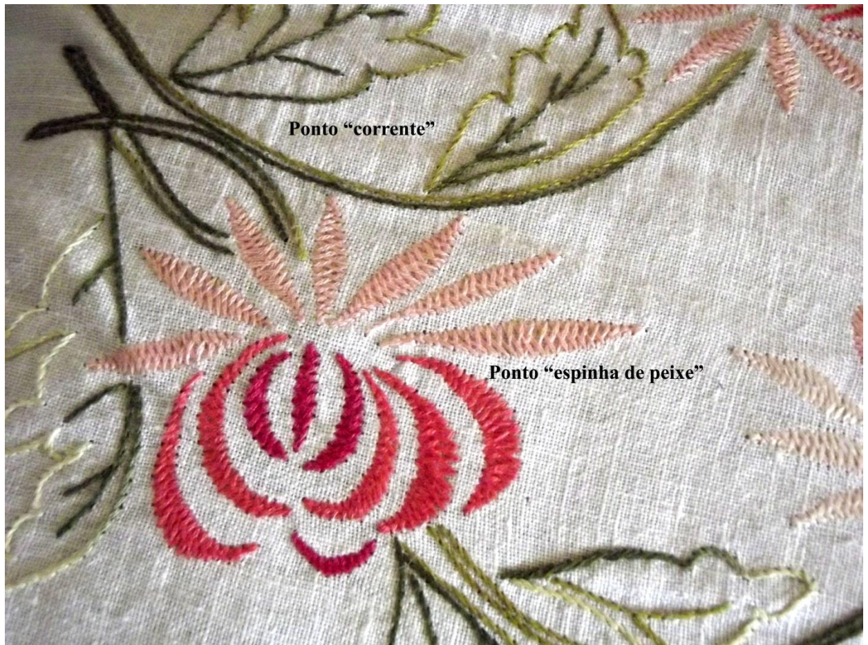
Fotografia 6 – Detalhe de uma capa de almofada bordada por D. Ignês.