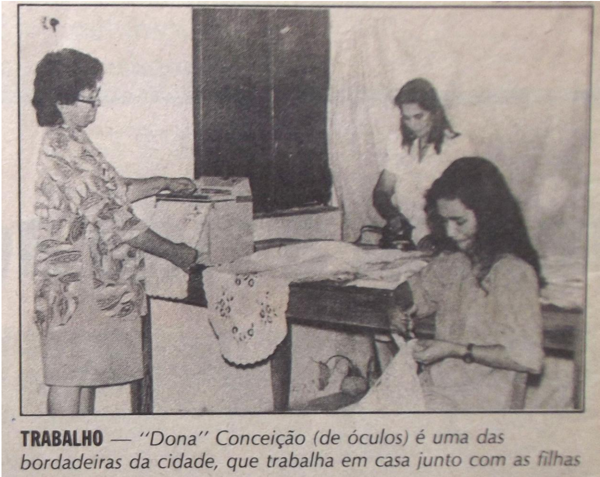
Fotografia 8 – “Trabalho em casa” em família.