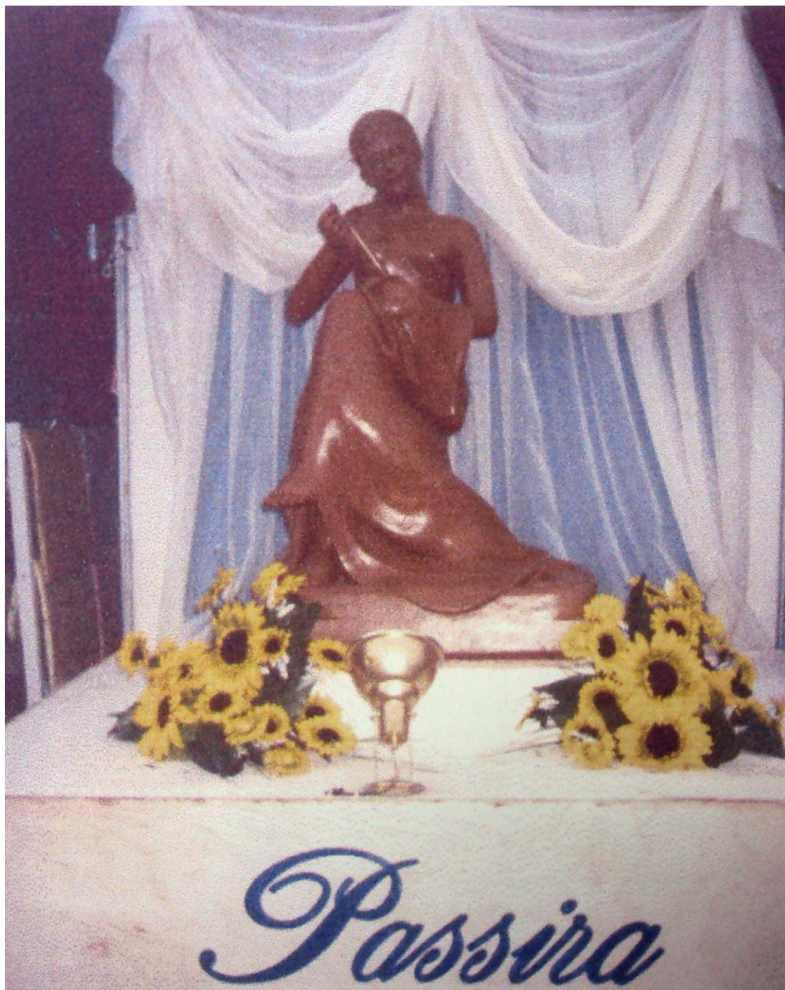
Fotografia 12 - Estátua representando uma bordadeira na entrada da XV Feira do Bordado Manual de Passira, 2001.