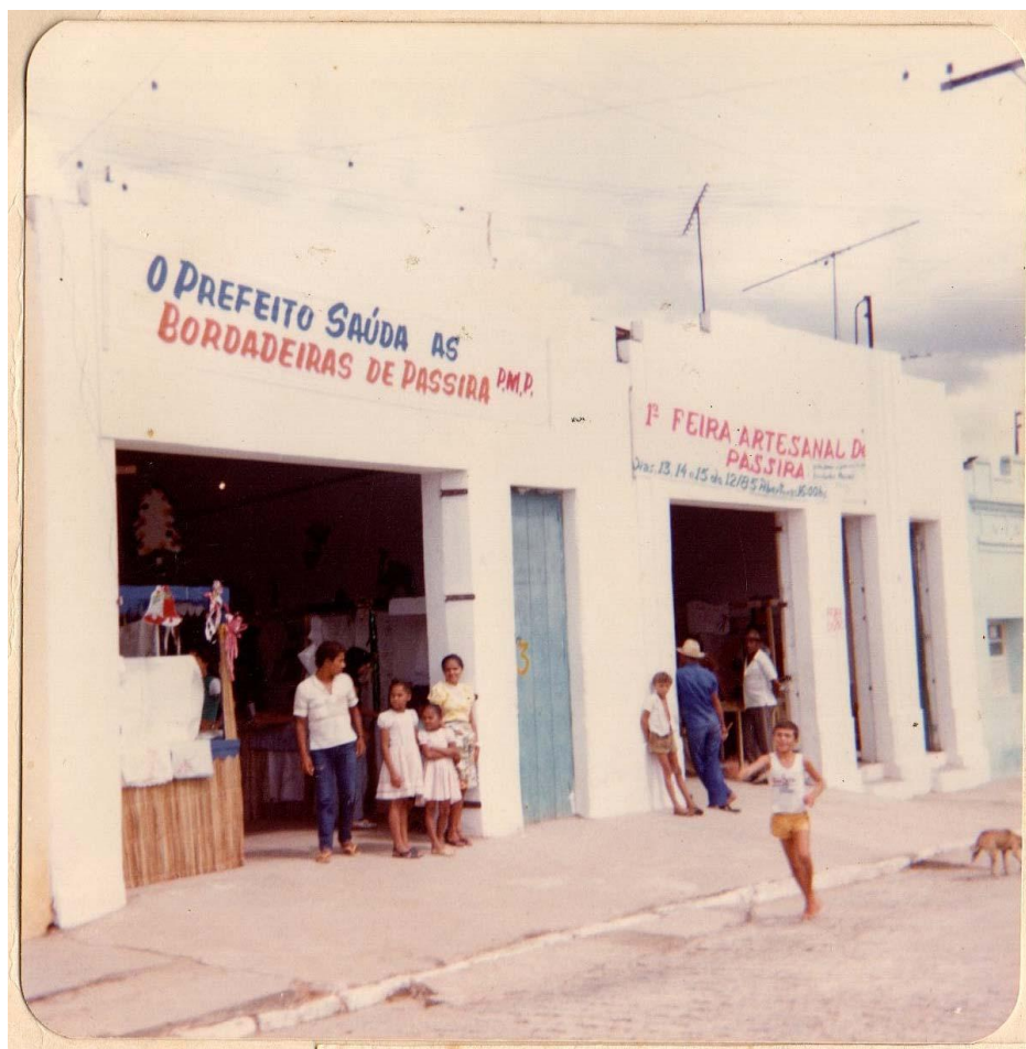
Fotografia 11 – Entrada da 1ª Feira Artesanal de Passira.