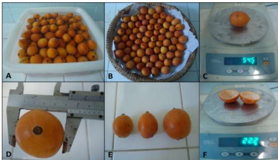
Figura 1: A: sanitização; B: drenagem; C: pesagem do fruto inteiro; D: medição de diâmetro; E: variabilidade de tamanhos; F: pesagem da casca.