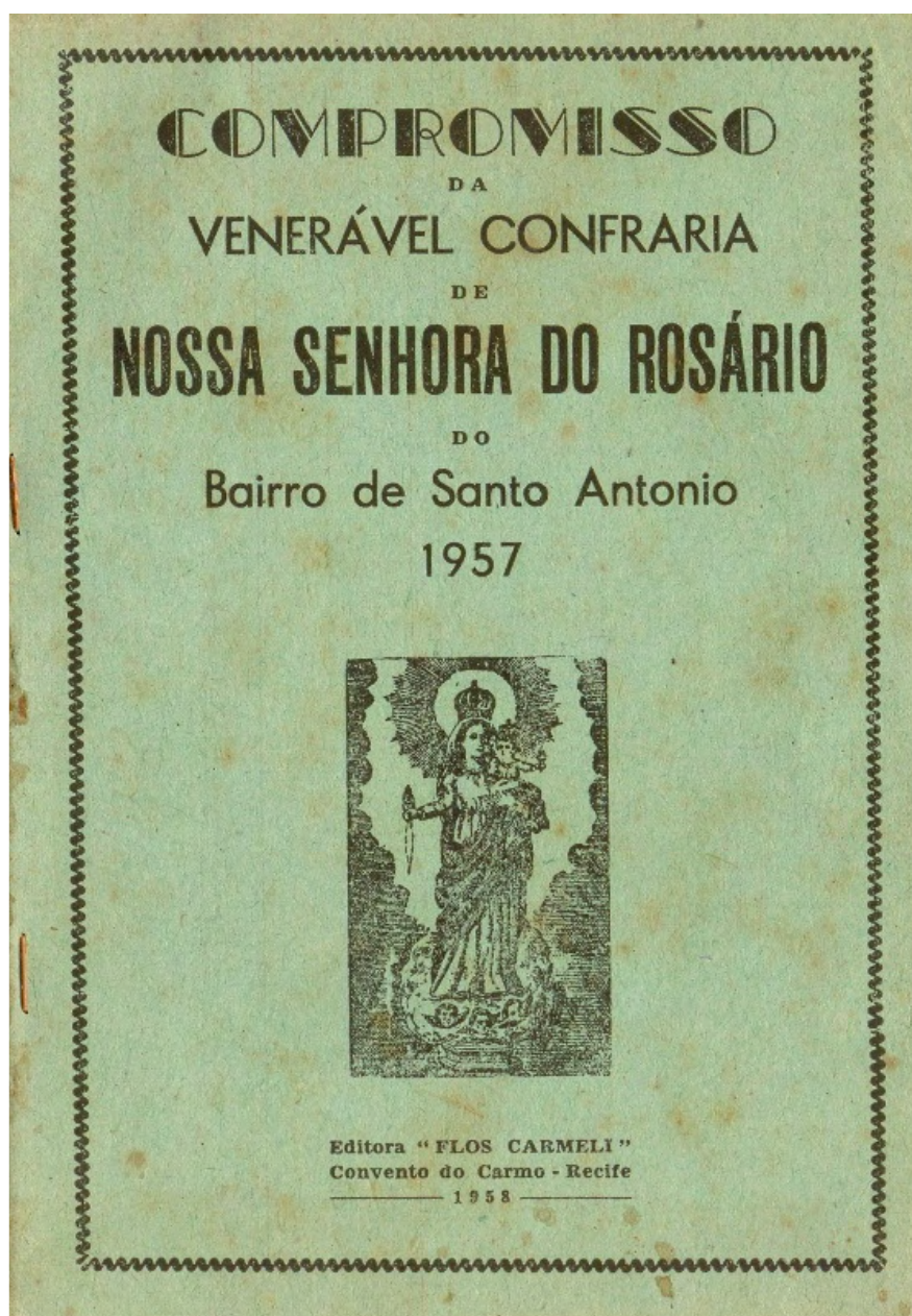
Capa do Compromisso da Irmandade de Nossa Senhora do Rosário dos Homens Pretos de Santo Antônio do Recife de 1957. Recife: Editora "Flos Carmeli", Convento do Carmo, 1958.