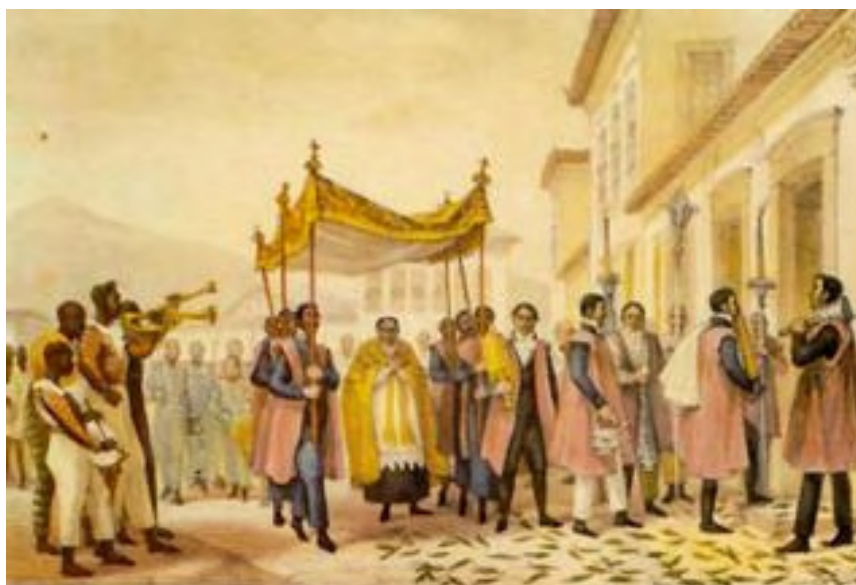
Ilustração 2 - DEBRET, Jean-Baptiste. Extrema-Unção. Viagem Pitoresca e Histórica ao Brasil 178 .

Uma das pranchas publicadas por Debret no já citado “ Viagem Pitoresca e Histórica ao Brasil ” retrata um cortejo de extrema-unção: