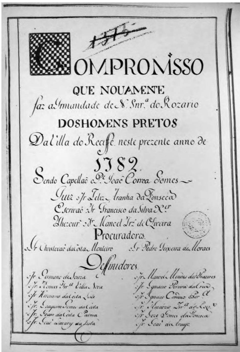
Capa do Compromisso da Irmandade de Nossa Senhora do Rosário dos Homens Pretos da Vila do Recife. AHU-PE. LAPEH-UFPE. Ano: 1782. Códice 1303.