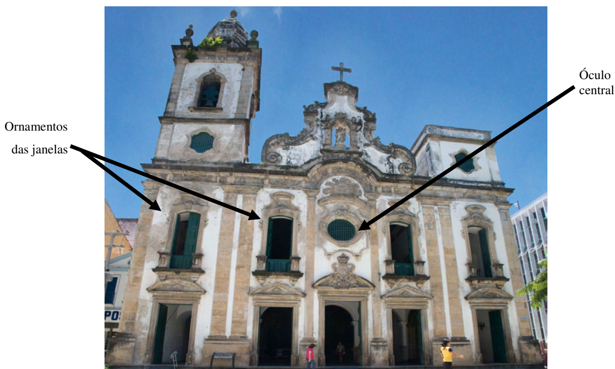
Ilustração 5 - Igreja de Nossa Senhora do Rosário dos Homens Pretos da Vila de Santo Antônio do Recife. Outubro de 2008.

Na foto abaixo, podemos visualizar o atual estado do frontispício do referido templo e as características descritas pelo autor: