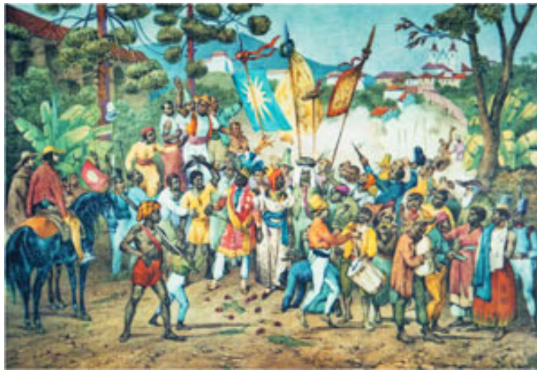
Ilustração 3 - Festa de Nossa Senhora do Rosário. Johann Moritz Rugendas 195 .

As festas na América Portuguesa estiveram essencialmente ligadas ao processo de conquista e à consolidação do poder imperial e católico. Religiosas ou não, retratavam de maneira teatral e simbólica as dificuldades de confrontação de costumes e valores distintos que conviveram e se misturaram no mesmo espaço, bem como a imposição dos valores tridentinos 196 .