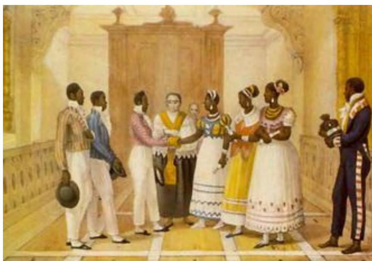
Ilustração 1 - DEBRET, Jean-Baptiste. Casamento de negros. Viagem Pitoresca e Histórica ao Brasil 78 .

Jean Baptiste Debret, pintor e desenhista francês que morou no Brasil de 1816 a 1831, publicou em sua obra “Viagem Pitoresca e Histórica ao Brasil” inúmeras imagens que retratavam o cotidiano do início do século XIX. Dentre elas, a de um casamento realizado entre escravos negros: