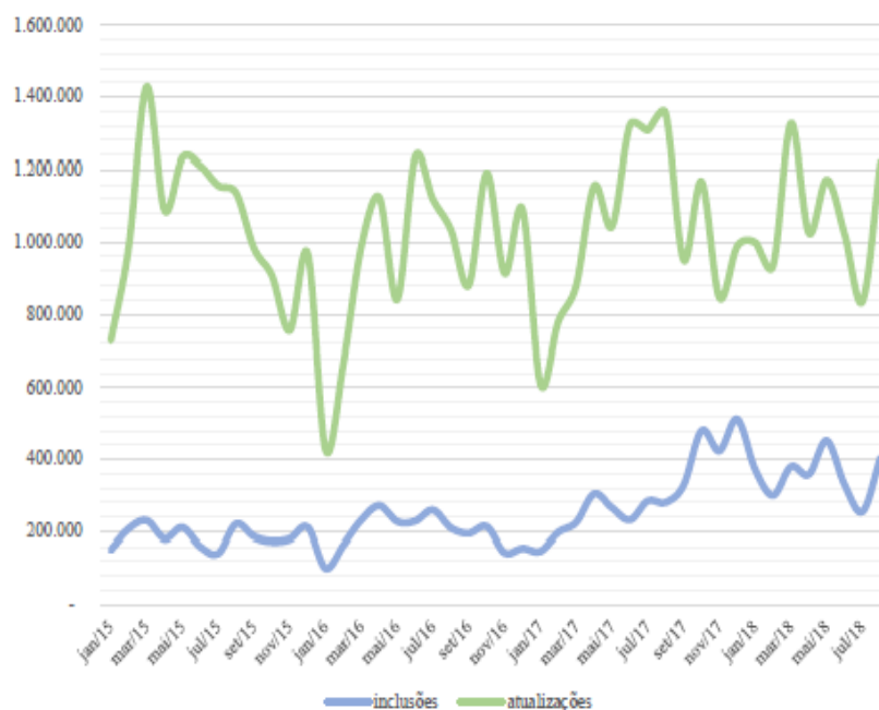
Gráfico A - Número de famílias incluídas ou atualizadas entre janeiro/2015 e agosto/2018.

Fonte: Decau/Senarc/MDS. Extraído de CHAVES et al. (2018, p. 130).