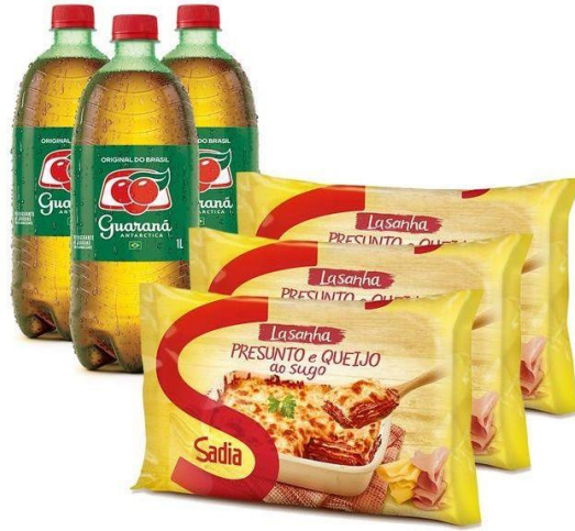
Figura 3: Propaganda Rede de Supermercado Carrefour.