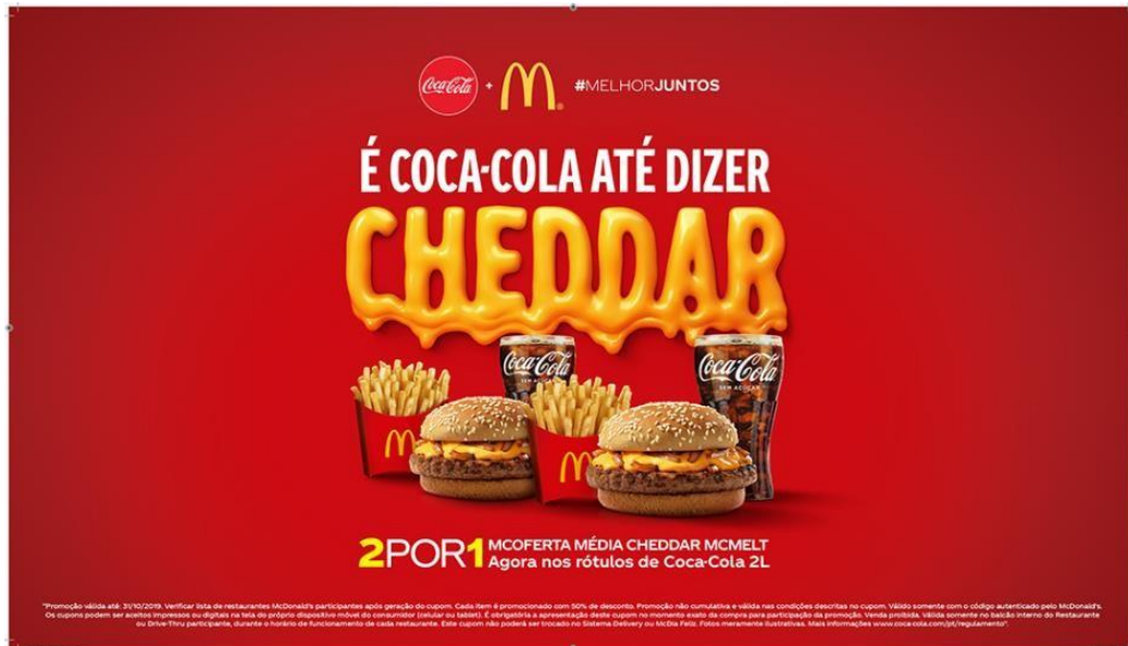
Figura 4: Promoção McDonalds e coca-cola