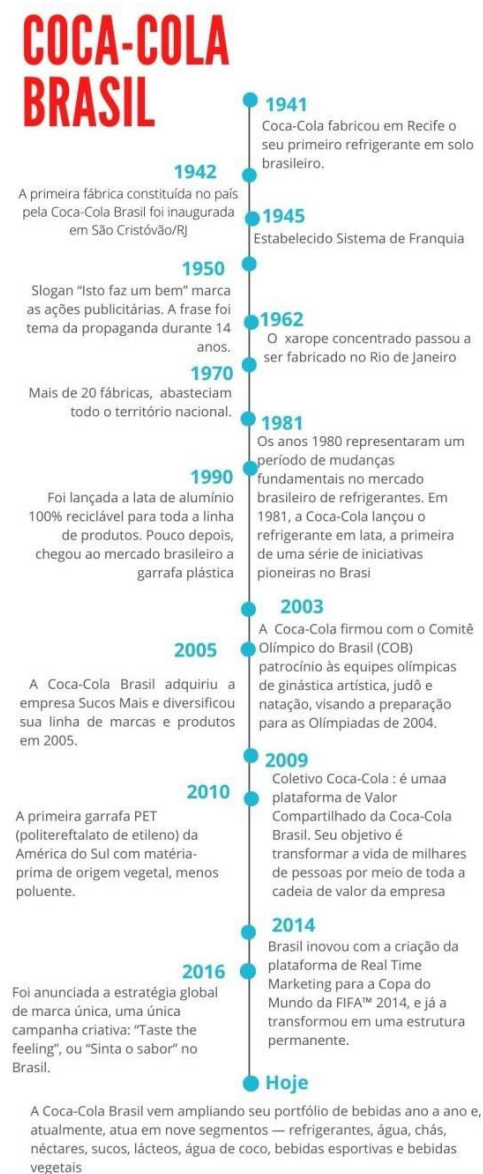
Figura 2: Coca-Cola no Brasil.

Algumas datas importantes relacionadas ao estabelecimento da Coca-Cola no Brasil (bebida, mercadoria, marca), estão organizadas na figura 2 abaixo em ordem cronológica.