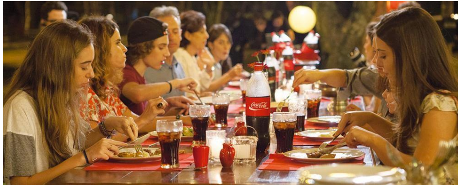
Figura 5: Imagem comercial