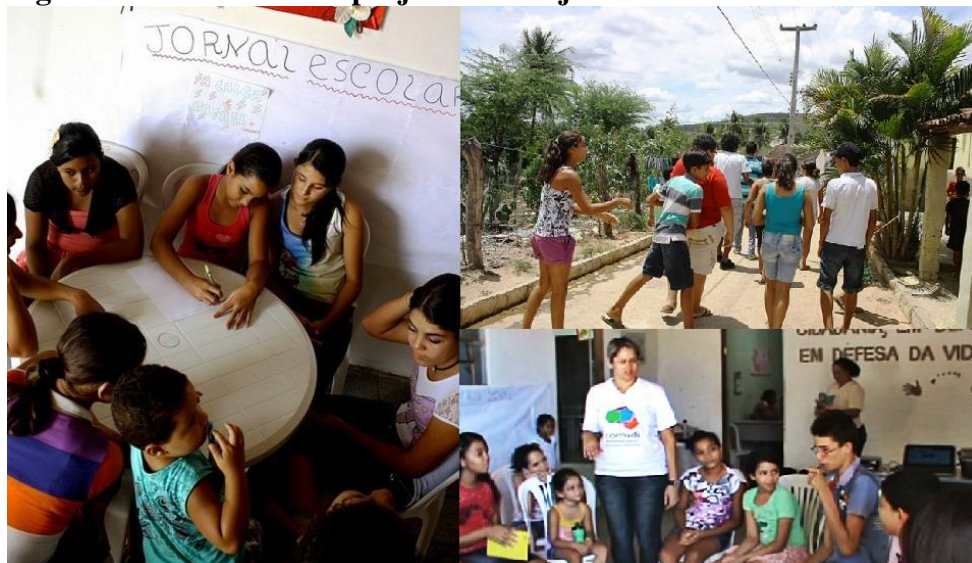
Figura 03. Atividades do projeto com os jovens.