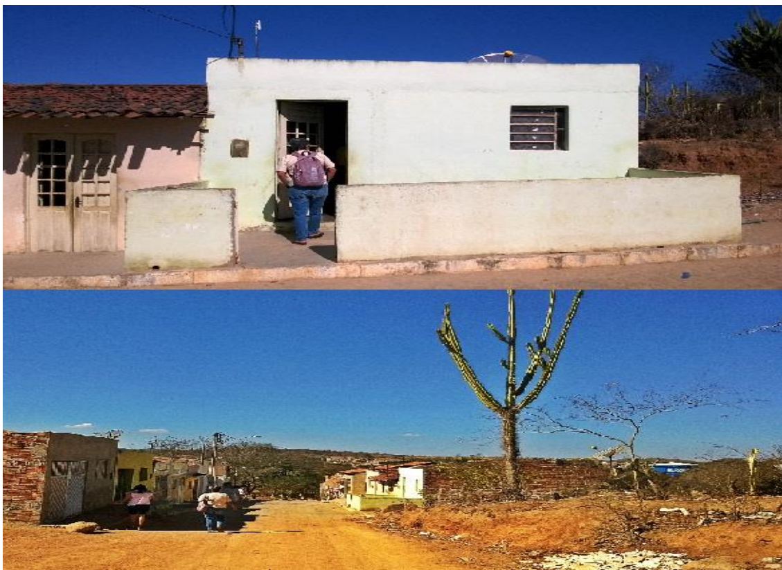
Figura 01. Visita na casa de moradores locais.

Acredita-se que epistemologias alternativas contribuem para emancipação científica de paradigmas positivistas que rejeitam estudos humanísticos e exaltam distinções e segregações entre: sujeito e objeto; natureza e sociedade e cultura, reduzindo as complexidades sociais e seguindo um modelo de desenvolvimento econômico excludente e desigual (SANTOS, 2010).