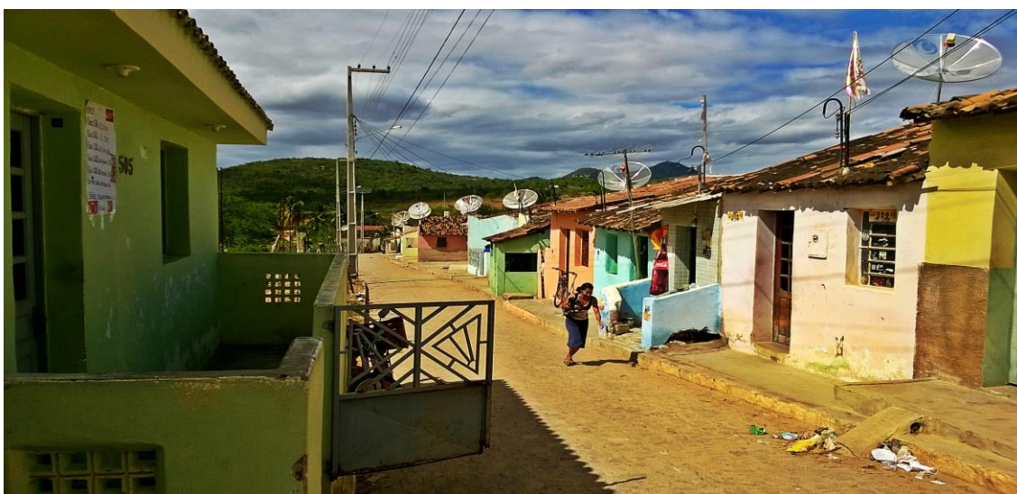
Figura 05. Antenas parabólicas nas casas em Cachoeira Seca.

A escassez ou ausência de políticas públicas que estimulem o empoderamento, o exercício da cidadania, a garantia de direitos e ao desenvolvimento local prejudicam o processo de construção de uma sociedade mais justa. Desta forma lugares como Cachoeira Seca, que não estão no epicentro dos interesses econômicos, mas que ainda sim fazem parte dele, alcançam apenas as pontas ou os restos, servem como peças descartáveis e quase invisíveis.