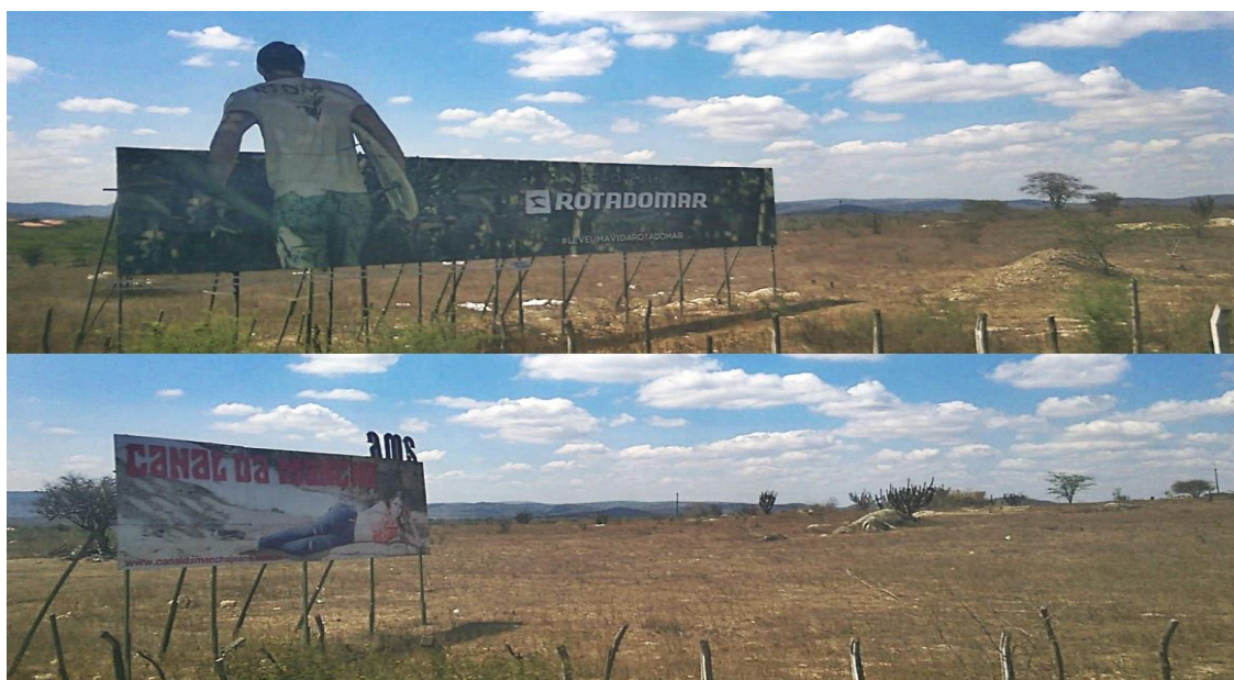
Figura 04. Outdoors de publicidade de marcas de roupas na estrada.

As facções, fabricos, confecções são prestadores de serviço a empresas do setor têxtil, podem ser formalizados ou não, neste caso em Cachoeira Seca - como ocorre em outros lugares na região do PCA de Pernambuco - as atividades não são regularizadas, as famílias trabalham informalmente, não possuem direitos trabalhistas, carteira assinada, salário ou auxílios médicos. O pagamento é estimado por produção, por quantidade de peças, o que resulta em jornadas indeterminadas de trabalho e a distribuição para demais membros da família, como os jovens.