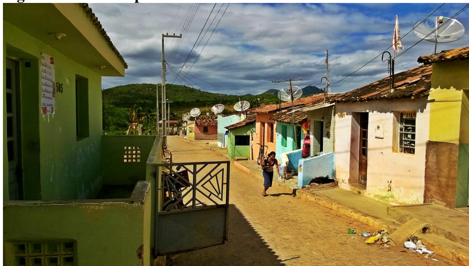
Figura 02. Antenas parabólicas nas casas em Cachoeira Seca.

A escassez ou ausência de políticas públicas que estimulem o empoderamento, o exercício da cidadania, a garantia de direitos e ao desenvolvimento local prejudicam o processo de construção de uma sociedade mais justa. Desta forma lugares como Cachoeira Seca, que não estão no epicentro dos interesses econômicos, mas que ainda sim fazem parte dele, alcançam apenas as pontas ou os restos, servem como peças descartáveis e quase invisíveis.