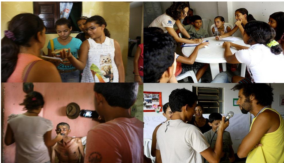
Figura 0. Jovens durante as oficinas.