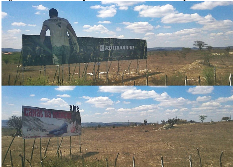
Figura 01. Outdoors de publicidade de marcas de roupas na estrada.

Cachoeira Seca pertence ao segundo distrito rural de Caruaru 15 , município de Pernambuco localizado a 135km da capital, Recife. Caruaru está no semiárido pernambucano, bioma característico no Brasil principalmente pela escassez de chuvas, o que remete a população à necessidade de outras fontes de produção econômica que não somente a agropecuária. Como parte integrante do Polo de Confecções do Agreste Pernambucano, que inclui seus vizinhos Toritama e Santa Cruz do Capibaribe, são impulsionados pela produção da indústria têxtil a utilização da mão de obra local, que em sua maioria não é qualificada e muito menos garantida em direitos.