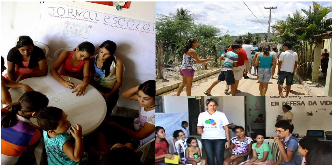
Figura 0. Jovens durante as oficinas.