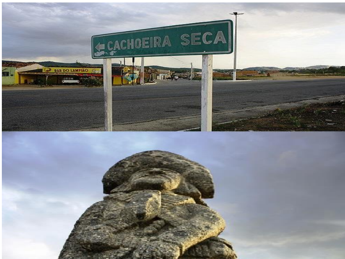
Figura 03 – Entrada de Cachoeira Seca com estátua de Vigulino Ferreira da Silva (Lampião).

só existia quando havia enchentes. Os moradores locais sobreviviam da agricultura (algodão; milho; feijão; abóbora; casas de farinha) ou do corte de cana na Zona da Mata Sul 5 . No entanto com o aumento na escassez de chuvas, típico do clima semiárido, com o crescimento da feira da sulanca 6 de Caruaru e a chegada das fábricas têxtil, a agricultura foi dando lugar outras formas de sustento econômico.