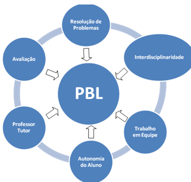
Figura 1 - Aspectos importantes PBL

autonomia do aluno; professor tutor; e avaliação. Esses aspectos têm como referências estudiosos da área como Ribeiro (2005), Vasconcelos (2012) e Almeida (2012), Moya (2015) e Gonzáles (2015). E diante deste contexto, segue abaixo a figura 1 que foi elaborada com base nos estudos discutidos no decorrer deste capítulo e que servirá como guia para as análises metodológicas: