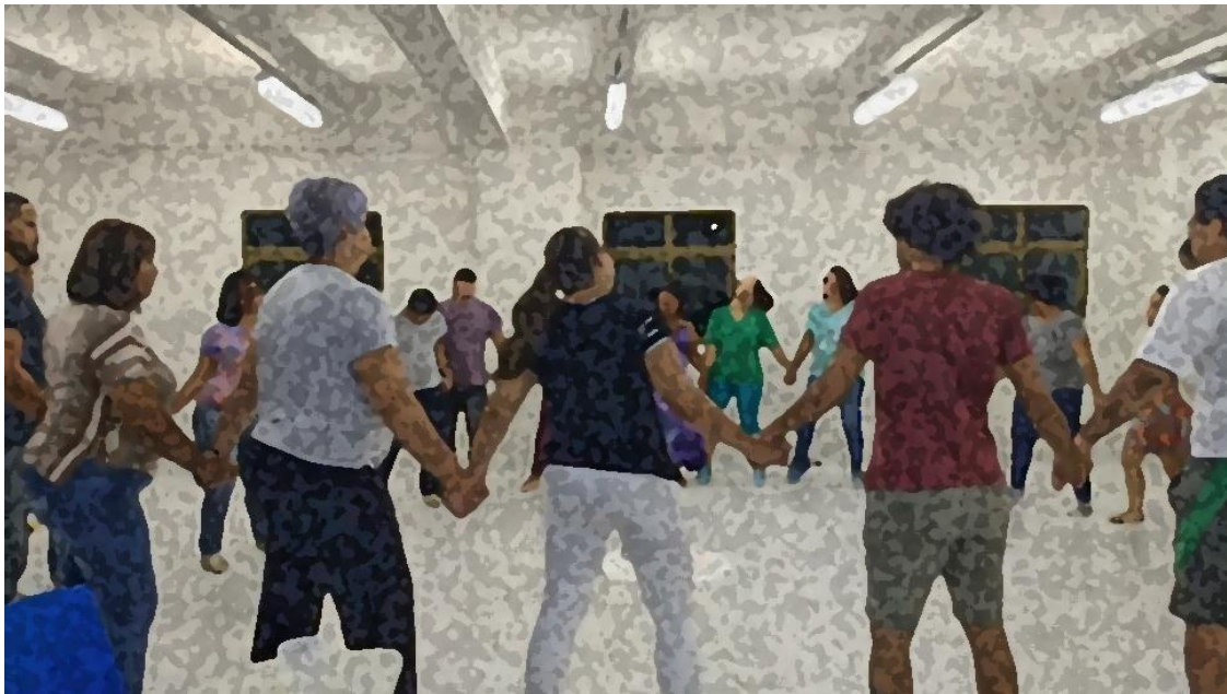
Fig.11– Vivência realizada em sala de aula.