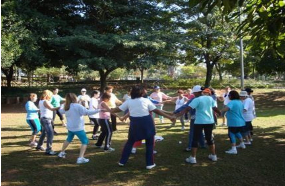
Figura 1 – Danças Circulares em parque público de São Paulo.

Fonte: https://www.prefeitura.sp.gov.br/cidade/secretarias/meio_ambiente/noticias/?p=230439