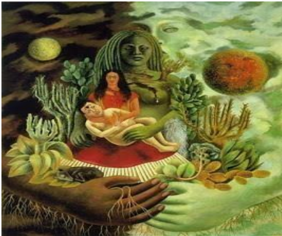
Fig. 15. A obra “O abraço amoroso entre o Universo, a Terra, Eu, o Diego e o senhor Xólotl” de Frida Kahlo