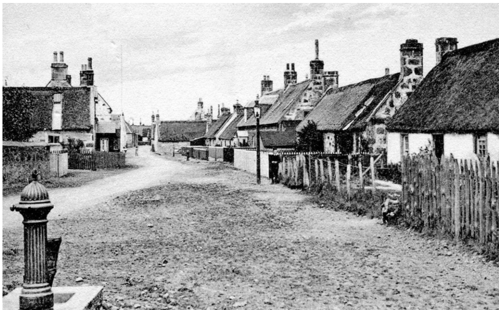
Figura 3- Ecovila de Findhorn em 1962