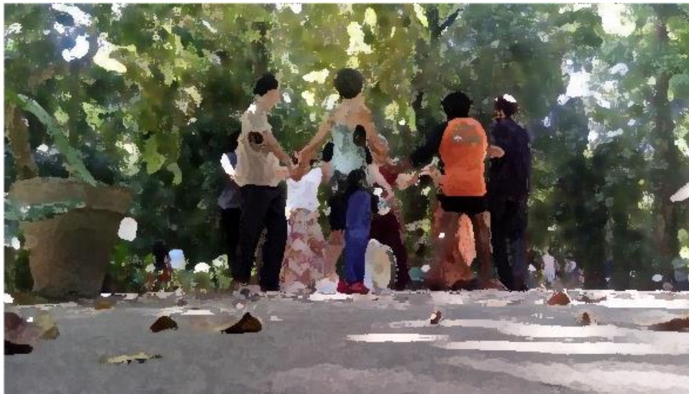
Fig. 8 – Dança Circular no Jardim Botânico do Recife