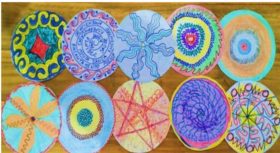
Fig. 12 – Mandalas elaboradas pelos alunos.

Após o momento da discussão dialogada (figura 13) foi realizado um momento artístico, com a produção de pequenas mandalas 7 (figura 10) de papel, os estudantes estariam livres para criar as próprias mandalas e após, dialogar com a turma sobre os sentidos usados nas cores e formas utilizadas, bem como a falar uma palavra que remetesse ao sentido do desenho (figura 12).