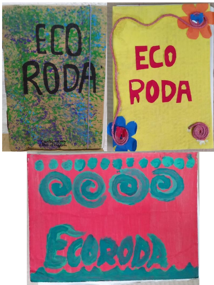
Fig. 6 – Livros Cartoneros produzidos após a vivência pelos discentes

Após o término das atividades, cada estudante recebeu um exemplar do livro Cartonero (Figura 8) e pôde compartilhar a leitura das narrativas (Quadro 4) elaboradas na Prática de Ecologia.