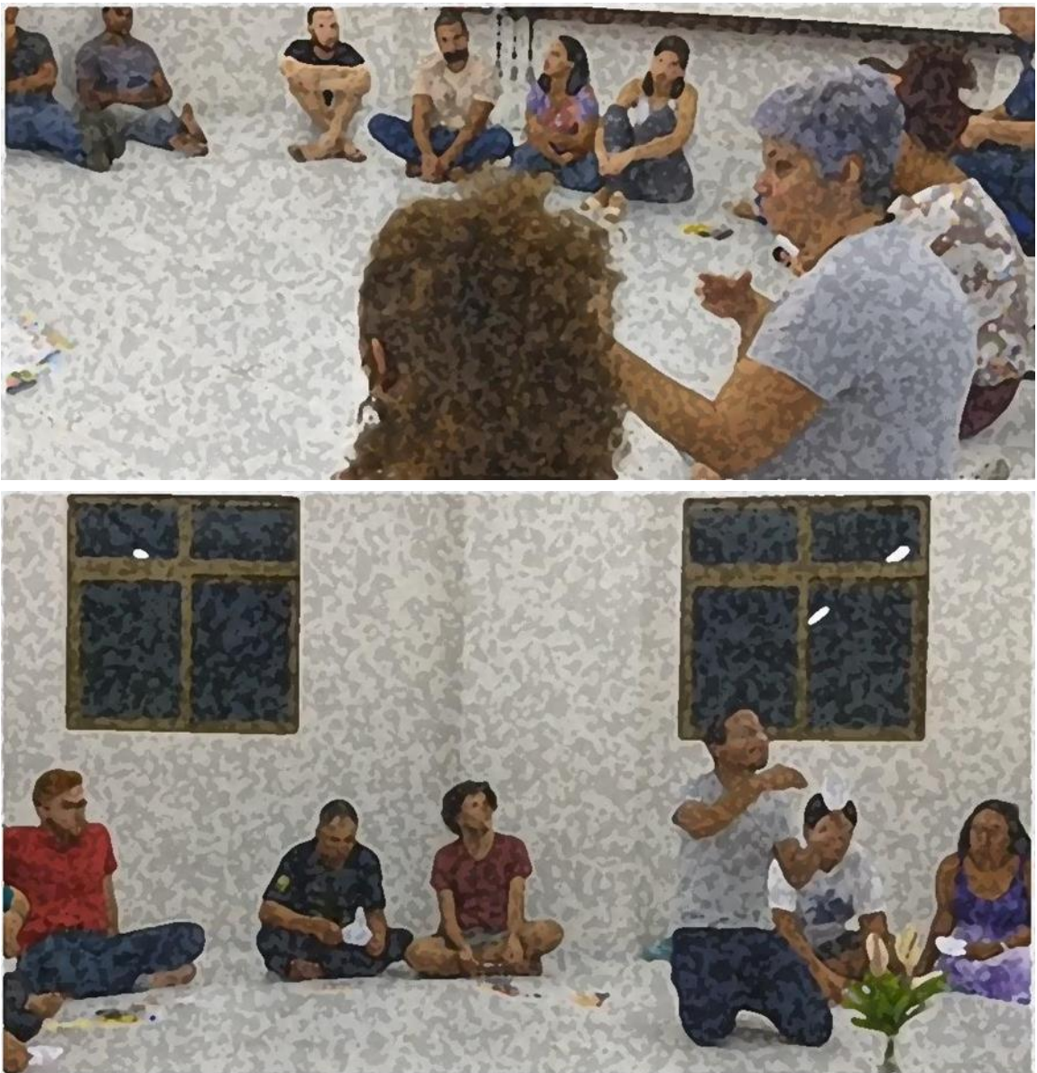
Fig. 13 – Roda de diálogo

Ao inserir as mandalas no círculo, os participantes puderam dizer uma palavra que significasse aquele momento para eles e que também relacionasse ao desenho produzido. Algumas das palavras faladas foram: gratidão, união, cooperação, esperança, fé e sinergia.