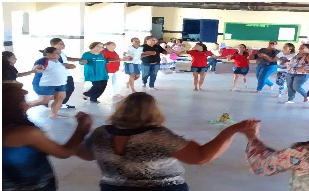
Fig. 9 - Dança Circular em escola de ensino médio do interior do Estado de PE