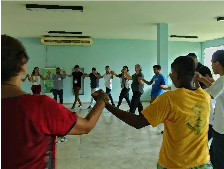
Fig. 10 – Dança Circular no I Encontro da Juventude em defesa do Rio Capibaribe