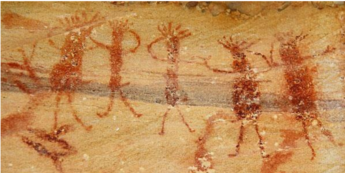
Figura 2 – Pintura rupestre, representando uma dança primitiva – Serra da Capivara