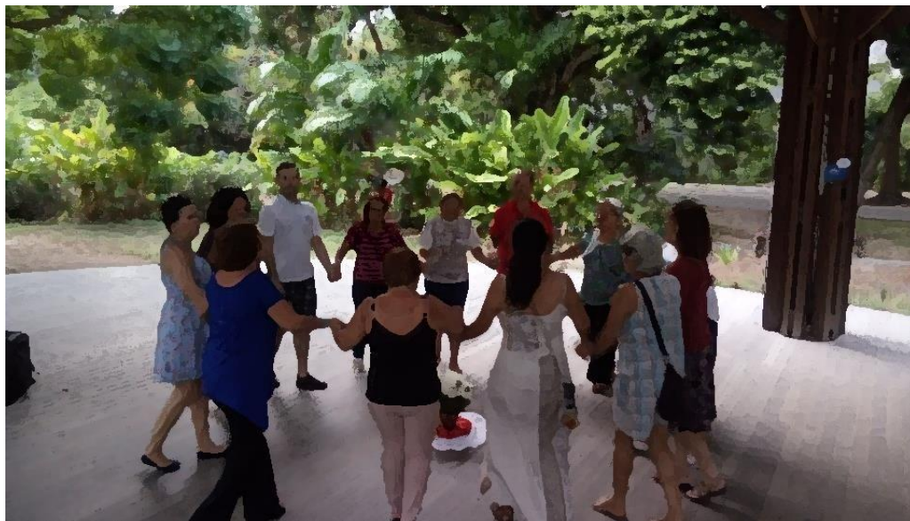
Fig. 7 – Dança Circular no Econúcleo do Parque da Jaqueira

Nosso trajeto, foi iniciado ao participarmos de rodas de Dança Circular no Núcleo de Educação Ambiental do Parque da Jaqueira (figura 4), no Jardim Botânico do Recife – JBR (figura 5), junto a um grupo de professores de Ensino Médio de uma Escola de Referência do interior do estado (figura 6) e no Encontro da Juventude Capibaribe – ENJUCA (figura 7).