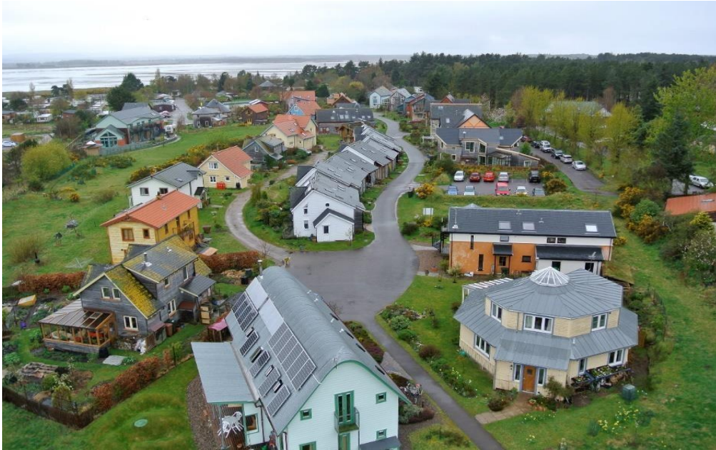
Figura 4 - Ecovila de Findhorn em dias atuais.