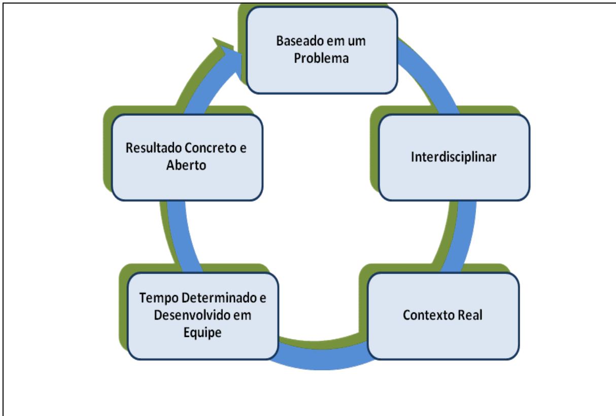
Figura 2 - Relação das características essenciais da PBL