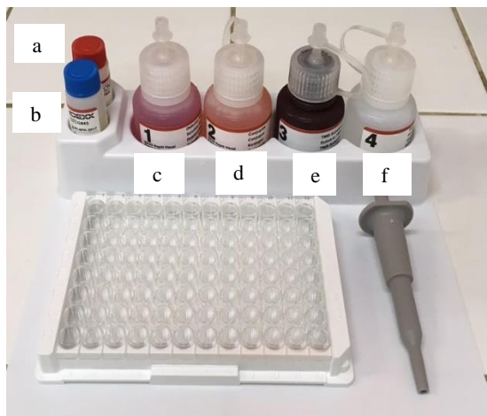
Figura 3: composição do kit VISUAL: controle negativo (a); controle positivo (b); solução detectora de PAG (c); Peroxidase de raiz forte (d); substrato TMB (e); solução interruptora (f).

o substrato de tetrametilbenzina (TMB) foi adicionado aos poços (Figura 3e). Sendo utilizada, ao final dos processos, a adição da solução interruptora (Figura 3f).