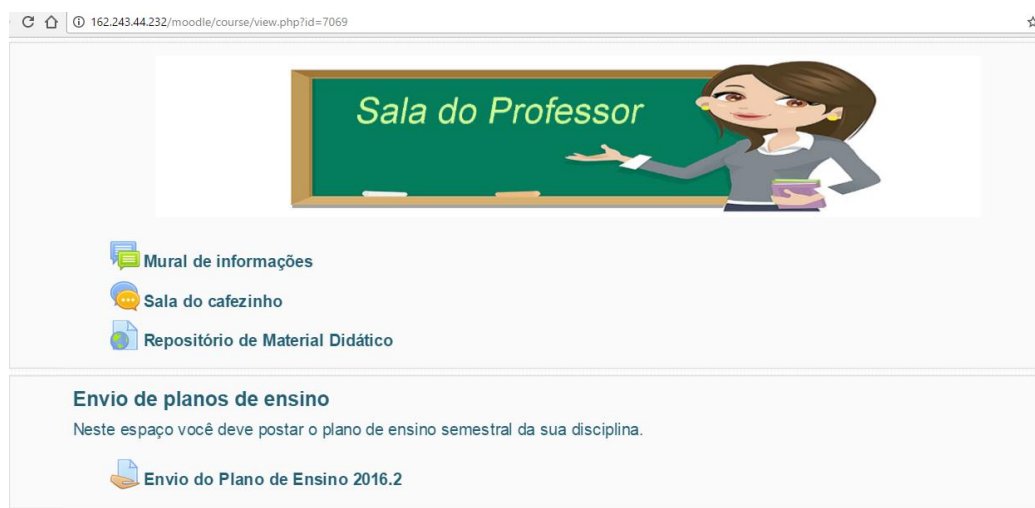
Figura 1- Print da tela inicial da Sala do Professor no ambiente Moodle