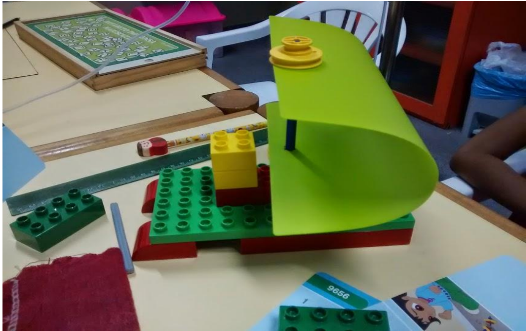
Figura 3 – Barco feito com LEGO