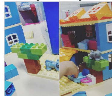
Figura 2 : Legó