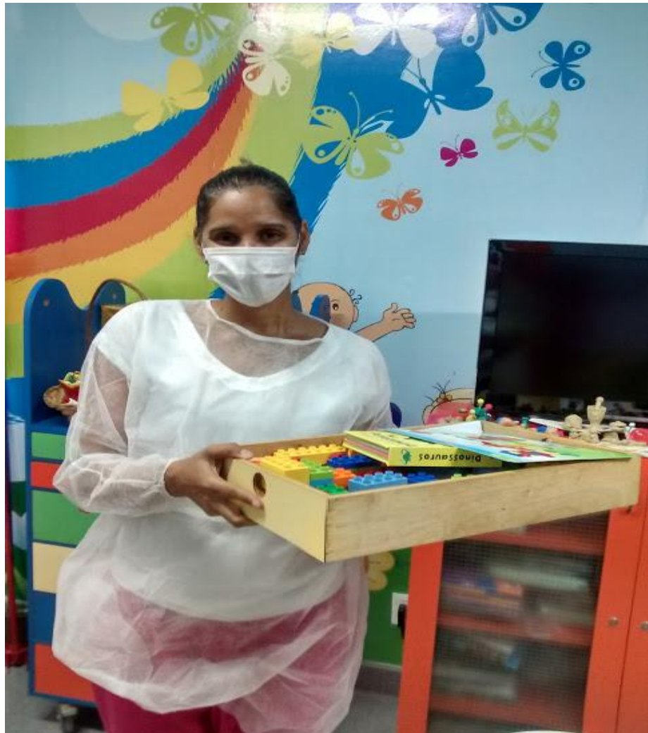
Figura 5 - Pesquisadora no ambiente da classe hospitalar, vestimentas e bandeja