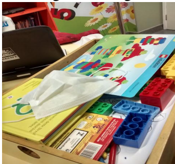
Figura 1 : Legó

Legó : seu modelo educacional compreende que tecnologia não é apenas um produto do conhecimento e da técnica acumulada ao longo dos anos, mas sim, é o saber fazer, um processo o qual encaminha o ser humano a buscar sempre a superação em suas tarefas. Os alunos trabalham em busca de soluções para resolver problemas relacionados a temas relevantes do mundo real. Um modelo que proporciona operacionalizar, o saber fazer e a construção do conhecimento de maneira sistêmica e holística, o que contribui para o desenvolvimento das habilidades, competências, atitudes e valores para a vida.