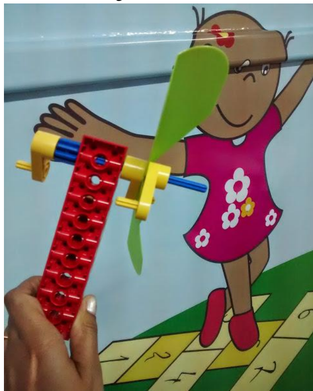
Figura 4 – Hélice de LEGO