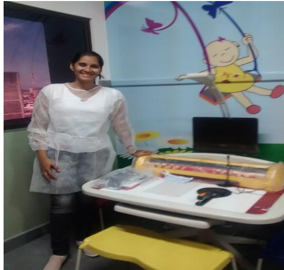
Figura 3: mesa educacional na classe hospitalar