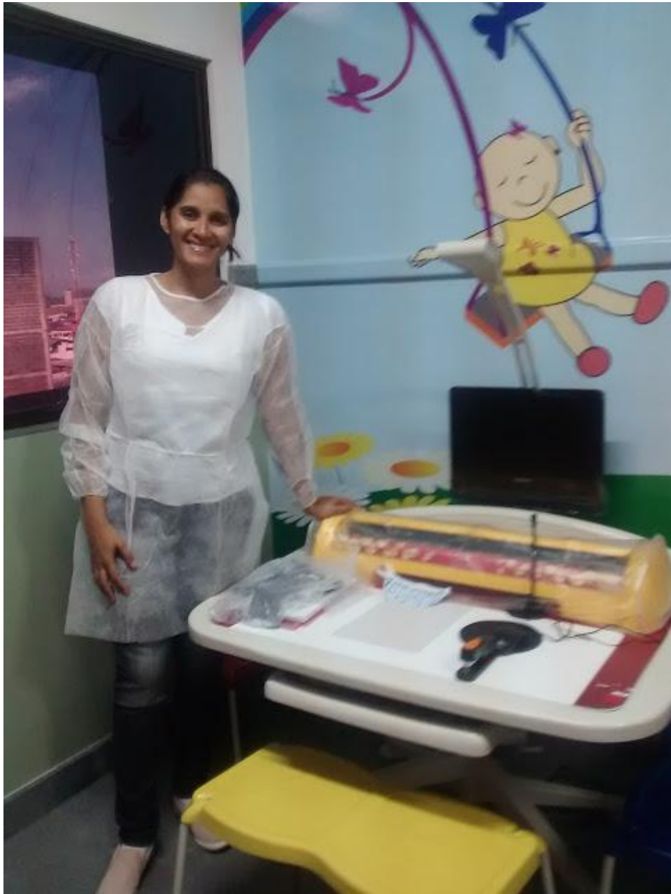
Figura 6 - Pesquisadora e a mesa educacional

A Figura 6 abaixo, mostra a pesquisadora e a mesa interativa, uma das tecnologias utilizada na classe hospitalar.