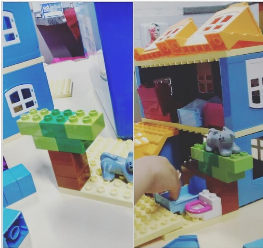
Figura 2 - LEGO

Descrevendo um pouco acerca da tecnologia LEGO, (Figura 2), seu modelo educacional compreende que tecnologia não é apenas um produto do conhecimento e da técnica acumulada ao longo dos anos, mas sim, é o saber fazer, um processo o qual encaminha o ser humano a buscar sempre a superação em suas tarefas. Os alunos trabalham em busca de soluções para resolver problemas relacionados a temas relevantes do mundo real. Um modelo que proporciona operacionalizar, o saber fazer e a construção do conhecimento de maneira sistêmica e holística, o que contribui para o desenvolvimento das habilidades, competências, atitudes e valores para a vida.