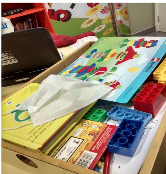
Figura 1 - Alguns dos materiais da classe hospitalar

A Figura 1 a seguir, foi tirada pela autora e mostra alguns dos materiais utilizados na classe.