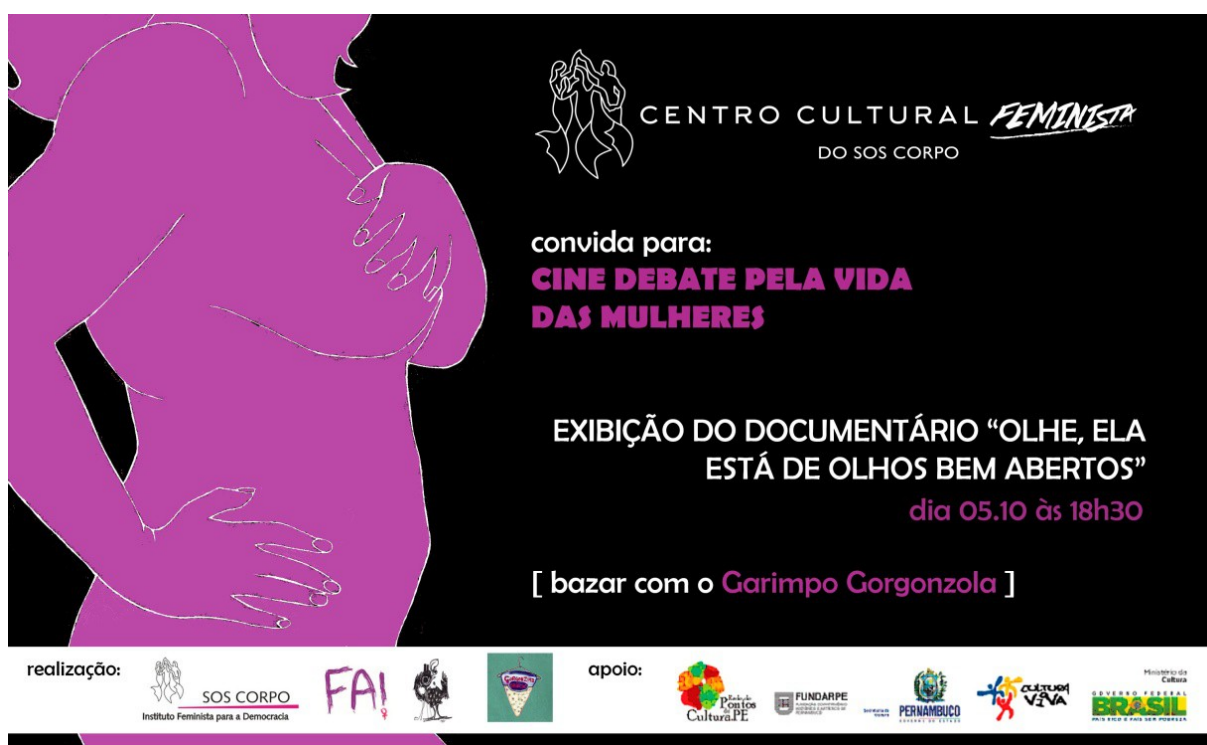
Imagem 7: Divulgação de Sessão Cineclubista

aborto, autonomia e autogestão, autodefesa, entre outros. Os temas geralmente eram escolhidos de acordo com o calendário das lutas feministas que participávamos. Desta forma, em 2013, discutimos sobre corpo e sexualidade em junho, por conta da proximidade com a Marcha das Vadias, que havia acontecido em maio; diversidade e lesbianidade em agosto, mês da visibilidade lésbica; em novembro, mês da consciência negra, trabalhamos racismo. Posteriormente, em 2015, realizamos uma sessão de cineclubes sobre aborto no início de outubro, por conta da proximidade com a data de luta pela descriminalização do aborto na América Latina (28 de setembro).