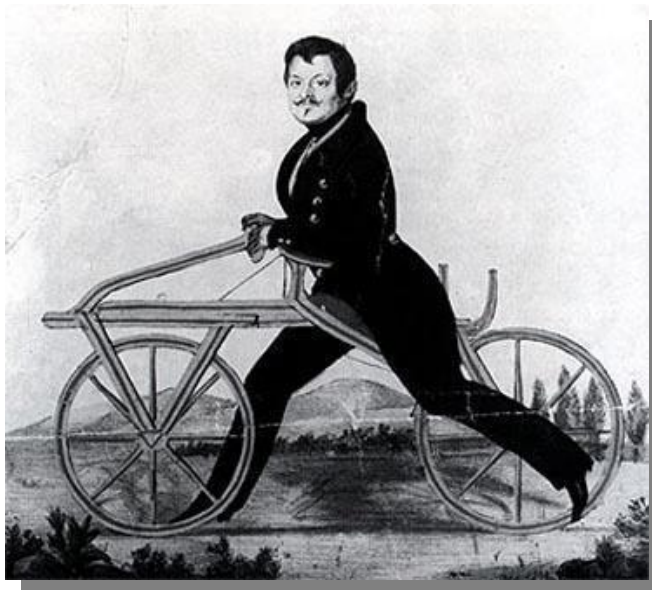
Figura 01: A bicicleta Draisiana

Na imagem seguinte podemos observar a paternidade da bicicleta feita pelo barão Von Drais