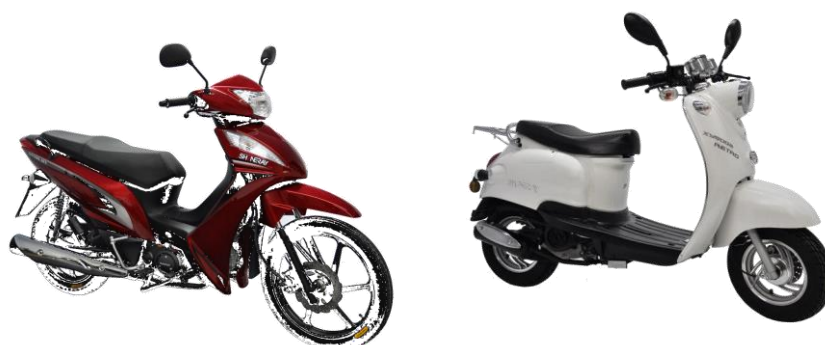
Figura 05: Cinquentinha Jet 50 (modelo popular) Figura 06: Cinquentinha Retrô 50

Além disso, a cinquentinha é um veículo que geralmente possui o tamanho reduzido frente a outros modelos de motocicletas. Cabe ressaltar que o seu tamanho e aspecto 63 podem variar segundo o modelo de cinquentinha . Como podemos visualizar nas imagens a seguir: