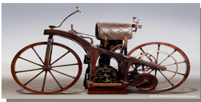
Figura 03: Einspur

O desenvolvimento neste motor, bem como a adaptação às duas rodas, formando o embrião da motocicleta, conforme diz Fausto Macieira (2009) é de Gattieb Daimler 48 com ajuda do seu amigo Maybach criou um motor o qual chamaram de relógio de pé, com 462cc e 1,2 hp de potência que possibilitava a fazer um veículo se movimentar. Pensaram em adaptar em um biciclo, por ser leve, de fabricação simples, prática e barata e que se adaptava à situação. O que podemos chamar de uma das primeiras motocicletas foi a versão final batizada de Einspur, com chassi de madeira, com rodas de madeira e com o motor 212cc e 0,5 hp de pontência a 600 rpm 49 . Como podemos ver na imagem 3: