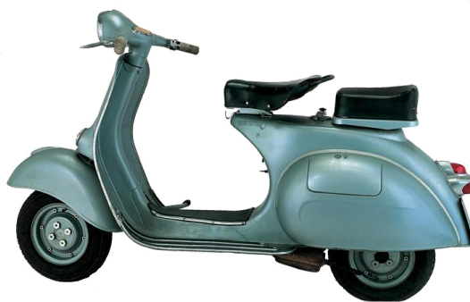
Figura 04: Vespa-1960