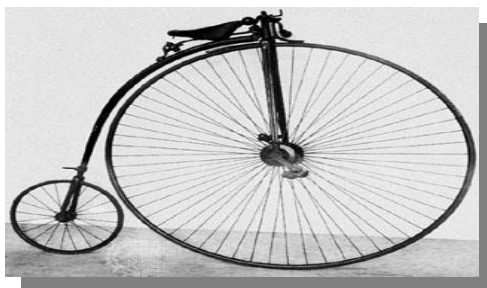
Figura 02 : Velocípede- Michauline: proibida para baixinhos

pedais. Posteriormente, Frances Pierre (1813-1883) e seu filho Ernest Michaux, em 1861, inventaram o chamado “velocípede”, “uma bicicleta com pedais (no formato da de McMillan) adaptados à roda dianteira 44