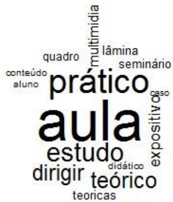
Figura 1. A Nuvem de palavras das respostas dos questionários composta das palavras mais frequentes contidas nas respostas dos questionários.