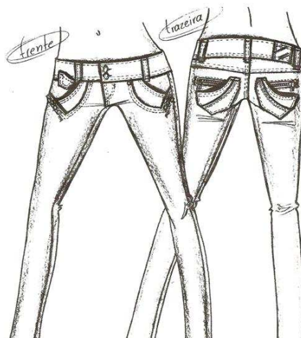
Figura 3: desenho técnico manual, concedido pelo Designer de moda 2.

No caso da empresa pesquisada, o desenho técnico é criado a partir de dois procedimentos: por meio das ferramentas de um software gráfico de computador, o Corel Draw (Figura 2), ou por meio de traçados manuais (Figura 3), que são escaneados e inseridos no sistema do microcomputador. Esses desenhos vão dar a ideia geral da roupa antes de ela ser costurada. Além do desenho, é feita a modelagem, ou seja, o molde da roupa em tamanho real e depois uma peça piloto, que corresponde à primeira peça montada da roupa para testar a modelagem, o caimento do tecido e fazer os reajustes necessários. Todas as alterações feitas são repassadas para a modelagem e só depois é que esta segue para ser cortada em grande quantidade.