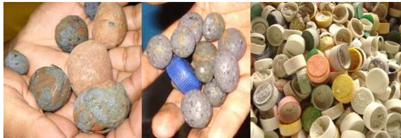
Figura 9: pedras utilizadas nas lavagens com cloro para desbotar o jeans confeccionado. Tampas descartáveis misturada ao pó abrasivo utilizada na lavagem a seco para o envelhecimento do jeans. (Foto da autora).

Nessa máquina não lava nem com água, nem com vapor. Ela lava a seco. A gente usa tampa de garrafas descartáveis, pó e cloro. É um pó abrasivo, feito do pó da pedra. O efeito é uma peça envelhecida (Designer de Lavanderia 2, 2009).