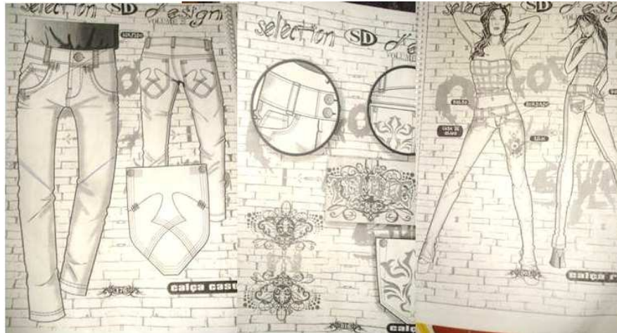
Figura 1: páginas de um book de moda, utilizado pela modelista entrevistada.

Hoje, empresas de maior porte, como o Atacadão de Jeans, possuem um setor de planejamento e criação. E, neste caso, percebe-se um esforço no sentido de criar um projeto previamente, ou seja, o produto é planejado antes de ir para a linha de produção, inclusive considerando a ficha de vendas. Como revela a Designer de Moda 1: