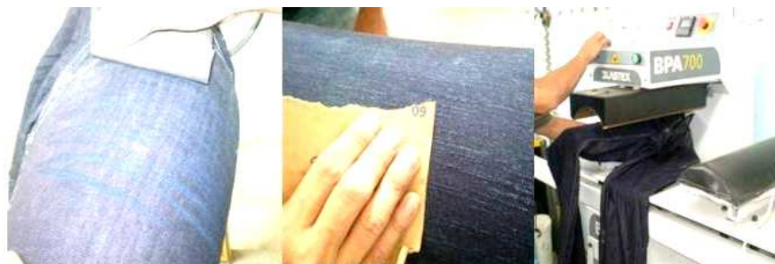
Figura 10: diferenciado produzido artesanalmente - uso da lixa e uso da máquina. (Foto da autora).

O surgimento das lavanderias gerou e gera ainda hoje um grande número de empregos, além de ser responsável pelo design de superfície da moda produzida em Toritama. Entretanto, do ponto de vista ambiental, tem sido responsável pela poluição do ar e do rio Capibaribe. Inclusive já havia apresentado sinais negativos, desde a implantação da primeira lavanderia, como revela a fala do Empresário 2,