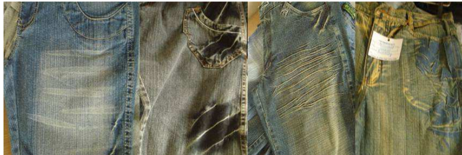
Figura 7: diferenciados (design de superfície): bigode, flex-plin , amassadinho, manchado. (Foto da autora).

Já participei de curso de diferenciado da Texpal, da PQT, fornecedores de produtos químicos (Designer de Lavanderia 3, 2009).