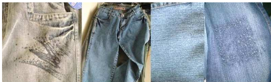
Figura 8: diferenciados (design de superfície): manchado, marmorizado, detalhe do marmorizado, puído. (Foto da autora).