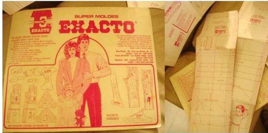
Figura 4: kit de modelagem Exacto da confeccionista 2.

As primeiras pessoas que começaram a trabalhar com modelagem lançaram mão de uma modelagem que você comprava ela pronta. Vinha de São Paulo – eram os moldes Exacto. Na época, eu trabalhava para minha prima e meus tios encomendaram de São Paulo. Era muito cara essa modelagem. Quase ninguém tinha ela aqui. Ela era uma modelagem de cartolina duplex. Porque naquela época não existia um estilista que ia criar sua modelagem. Existia o quê? Alfaiate e essas modelagens industriais que as empresas se baseavam por isso. Então aqui, meia dúzia de pessoas que se preocuparam com a modelagem, encomendaram de São Paulo (Confeccionista 1, 2009).