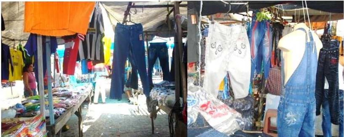
Figura 11: Feira da Sulanca de Toritama

A primeira feira começou perto da igreja matriz, ali perto da prefeitura, por volta de 1990. Tinha uns bancos e as pessoas também vendiam no chão. Depois ela foi para as margens da BR, próximo à ponte e havia muita insegurança para os feirantes e para os clientes. E em 2002, ela veio para perto do Parque das Feiras. Havia uma necessidade de ampliar essa feira e de centralizar a venda num lugar só (2009).