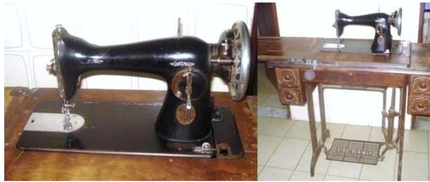
Figura 6: máquina doméstica de pedal da Confeccionista 2.(Foto da autora).

Quanto ao acabamento interno das peças, esse não era feito. Segundo a Confeccionista 2 (2009), ela utilizava tesouras de picotar para evitar que o tecido desfiasse. Isso porque ainda não havia máquinas no local para fazer esse tipo de acabamento nas roupas costuradas.