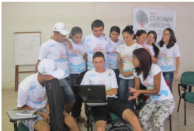
Figura 1: Jovens comunicadores do projeto Riachos do Velho Chico.

também um instrumento pedagógico para a inserção desse trabalho com a juventude (LAUDENICE OLIVEIRA).