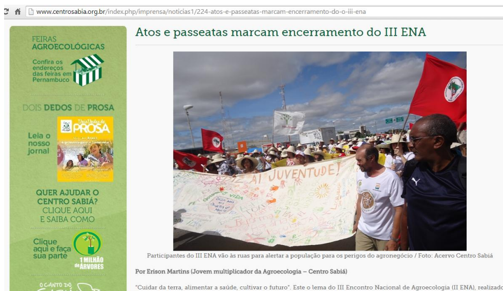
Figura 6: Matéria dos jovens publicada no site do Centro Sabiá.

As matérias produzidas pelos jovens também são hospedadas na página eletrônica do Centro Sabiá, com assuntos sobre atividades ou eventos que participam, a exemplo de “Atos e passeatas marcam encerramento do III ENA”; “Encontro no Agreste reúne jovens rurais das três regiões do Estado para debater direitos; e comunicação” e “Encontro Territorial de Jovens Rurais do Agreste de Pernambuco debate sobre desafios e estratégias de permanência no campo”. Além de links para as redes sociais da instituição – como Facebook , Flickr , Uol Mais , YouTube e Twitter , esse espaço arquiva também o formato digital do jornal Dois Dedos de Prosa .