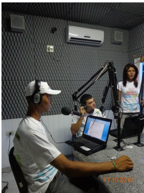
Figura 3: Jovens apresentando o programa.

comunidade, como as festas de padroeiros das comunidades, avisos de reuniões para as comunidades (ENTREVISTADO 3).