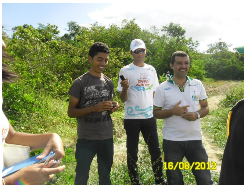
Figura 8: Jovem gravando matéria para o programa de rádio.

Fomos desafiados a escrever para outros meios de comunicação como o site, o Dois Dedos de Prosa e o Facebook (ENTREVISTADO 4).