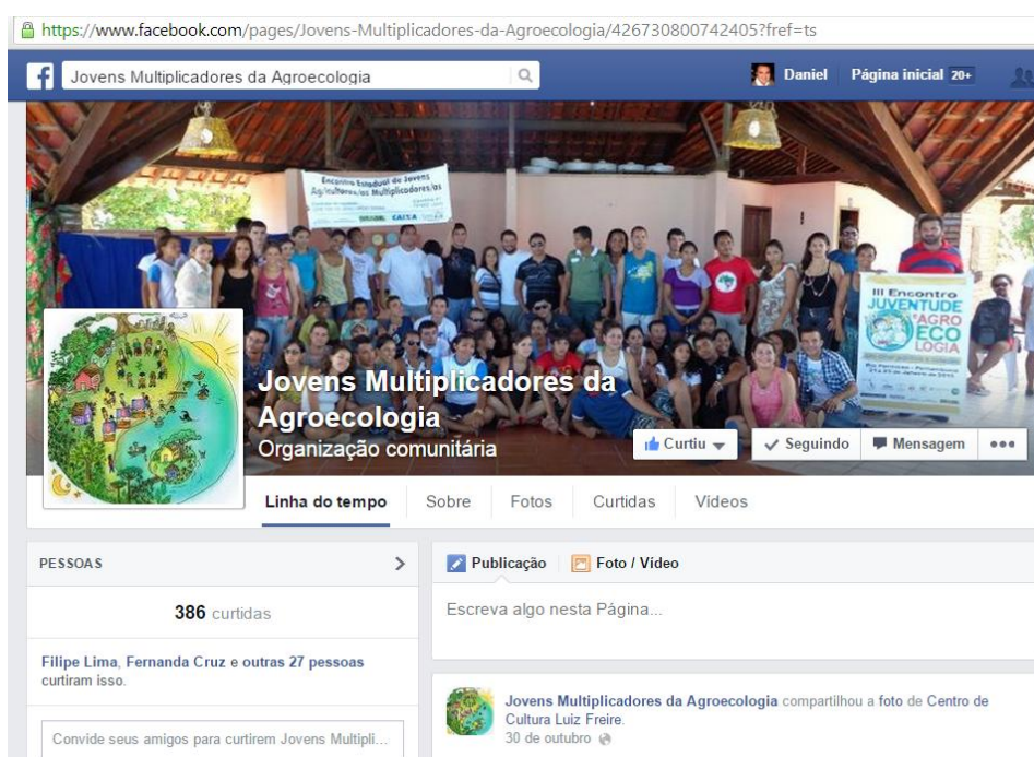
Figura 5: Fan page dos jovens comunicadores.

Os jovens também escrevem pequenos textos para o Facebook , cujo nome nessa rede social é Jovens Multiplicadores da Agroecologia . O espaço é chamado de fan page e é destinado a grupos, empresas ou organizações. Eles postam vídeos, fotografias, textos curtos e links de notícias sobre eventos e dicas de assuntos ligados ao contexto deles, como uso de agrotóxicos no Brasil; Seminário de Políticas Públicas para Jovens Mulheres; Oficina de Convivência com o Semiárido; Oficina de Comunicação; e votação do Estatuto da Juventude. Ao todo, são quase mil seguidores na página.