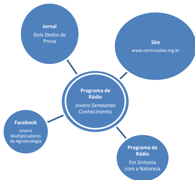
Figura 8: Representação da ação dos jovens produtores de conteúdo nos diferentes suportes midiáticos

Neste cenário, as apropriações são analisadas a partir das categorias de convergência midiática, já definidas anteriormente nesta pesquisa: i) mobilidade – operação do rádio em diversos espaços, além do programa Jovens Semeando Conhecimento tem o Facebook , o site do Centro Sabiá, o jornal Dois Dedos de Prosa e o programa Em Sintonia com a Natureza ; interação entre as mídias - a cooperação e as conexões com esses diversos suportes midiáticos; baixo custo operacional – o acesso e a operação aos meios de comunicação não tem custo algum; e versatilidade na produção de conteúdos – a produção das matérias, áudios, vídeos e fotografias a partir das diferentes linguagens nas várias plataformas midiáticas.