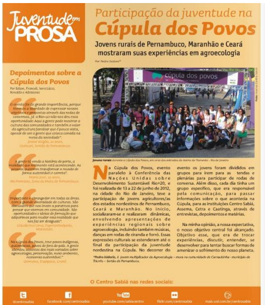
Figura 4: Jornal Dois Dedo de Prosa – Sessão Juventude em Prosa.