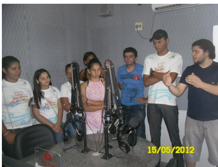
Figura 2: Jovens participando de formação sobre rádio.

Tivemos orientações sobre como manipular o gravador, como elaborar entrevistas, como fazer spot, como fazer vinheta, como fazer uma matéria. Depois, passamos para outros momentos sobre redes sociais e internet ; foi uma parte mais ampla. Também tivemos momentos de reflexões sobre direito à comunicação (Entrevistado 3).