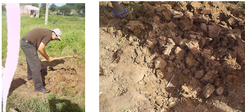
Figura 1. Fotos da coleta do solo (município Serra Talhada - PE).

O experimento foi realizado com um solo de uma área localizada no município de Serra Talhada no Estado de Pernambuco com clima Bsw'h' de acordo com a classificação de Köppen, adaptada no Brasil, muito quente e semi-árido, meso-região do Sertão do Alto Pajeú, tendo o solo sido classificado como solo Neossolo Flúvico salino-sódico textura média (DNOCS, 1999). Amostras do solo foram coletadas na camada de 0 a 20 cm, secas ao ar, destorroadas e peneiradas (peneira de 2 mm), (Figura 1).