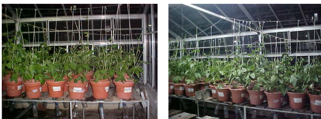
Figura 9. Foto geral antes da colheita.

O controle de umidade foi realizado com uso de sistema de drenagem com mangueira, para o recolhimento de água em excesso, através de garrafas de plástico adaptadas no fundo de cada vaso. Quando as plantas iniciaram a fase de floração (45 dias após a semeadura), foi realizada a colheita (Figura 9), da parte aérea e das raízes com nódulos.