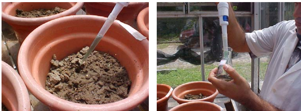
Figura 6. Plantio do feijão caupi e inoculação da estirpe bradyrhizobium BR 3267.

Os inoculantes com as estirpes de rizóbios foram produzidos no Laboratório de Biologia do Solo da Empresa Pernambucana de Pesquisa Agropecuária – IPA, em meio líquido contendo extrato de levedura e manitol (YM) na fase log (após cinco dias de crescimento), sendo considerada uma concentração mínima de 10^8 ufc mL -1 meio, seguindo a metodologia de Vincent (1970). Foram usadas as estirpes NFB 700, SEMIA 6156 e BR 3267, aplicadas isoladamente (Figura 6).