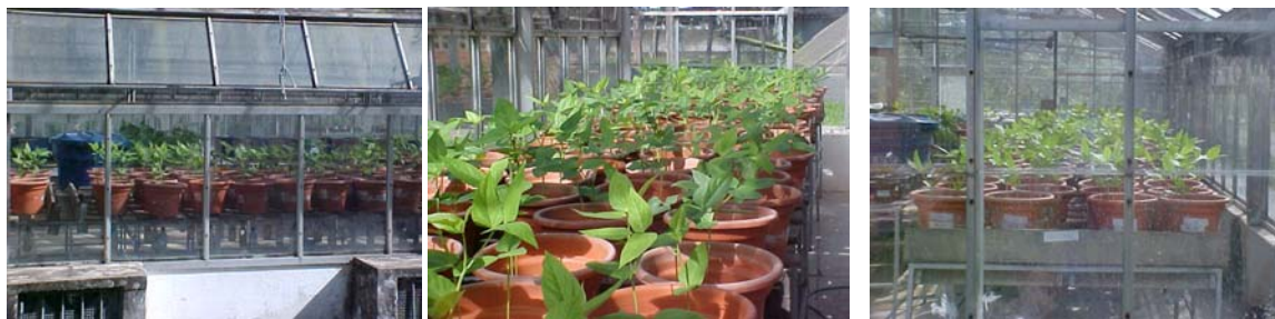
Figura 7. Desenvolvimento do feijão caupi após três semanas do plantio.