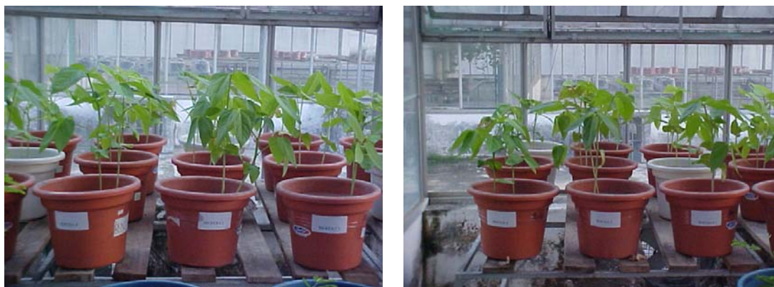
Figura 8. Desenvolvimento do feijão caupi após quatro semanas do plantio.

O controle de umidade foi realizado com uso de sistema de drenagem com mangueira, para o recolhimento de água em excesso, através de garrafas de plástico adaptadas no fundo de cada vaso. Quando as plantas iniciaram a fase de floração (45 dias após a semeadura), foi realizada a colheita (Figura 9), da parte aérea e das raízes com nódulos.