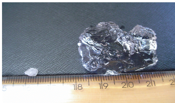
Figura 02. “hidratassolo” seco e hidratado

3.2.5 - O “hidratassolo” é um polímero artificial à base de acrilato de sódio, apresenta-se na forma granular, possuindo uma umidade residual em torno de 10% e uma distribuição por tamanho de grânulos de acordo com as seguintes classes: menores que 1,0 mm → 4,1%; de 1,0 a 2,0 mm → 29,5%; de 2,0 a 4,0 mm → 66,1%; e maiores que 4,0 mm → 0,3% (COELHO, 2004). Depois de hidratado possui a característica de liberar gradativamente água ao vegetal de acordo com a necessidade do mesmo.