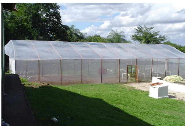
Figura 01. Estufa utilizada para condução dos experimentos

O experimento foi conduzido, em casa-de-vegetação (estufa) na Escola Agrotécnica Federal de Crato-CE e as análises realizadas nos Laboratórios da Universidade Federal Rural de Pernambuco (UFRPE), em Recife-PE. Foram utilizados, solo do tipo Espodossolo cárbico, Latossolo vermelho amarelo, esterco bovino e o polímero hidroabsorvente “hidratassolo”.