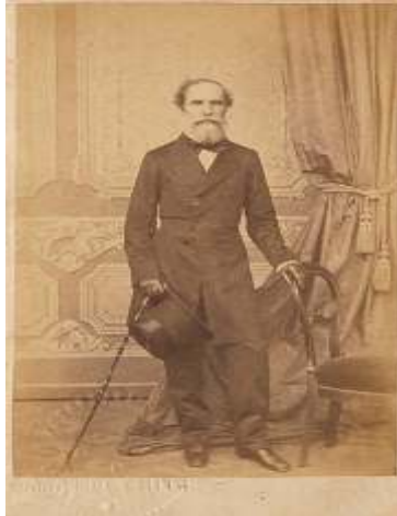
Francisco do Rego Barros

Em 1837, Rego Barros, ao assumir o governo de Pernambuco, tendo como meta realizar reformas de infra-estrutura para favorecer a produção econômica da região e melhorias nos equipamentos, procurou também estabelecer medidas para melhorar as condições de higiene de suas cidades e dinamizar os seus serviços públicos, tendo como auge o ano de 1842 quando engenheiros e arquitetos franceses, liderados por Louis Leger Vauthier, iniciaram esse projeto modernizante na Repartição de Obras Públicas. No ano de 1846, Vauthier, dada a quantidade de trabalhos a serem executados e a importância do nome do referido engenheiro em Pernambuco, teve o seu contrato de trabalho prorrogado por mais 13 meses, no qual foram engajados os engenheiros Portier e Lautier para auxiliá-lo. 123